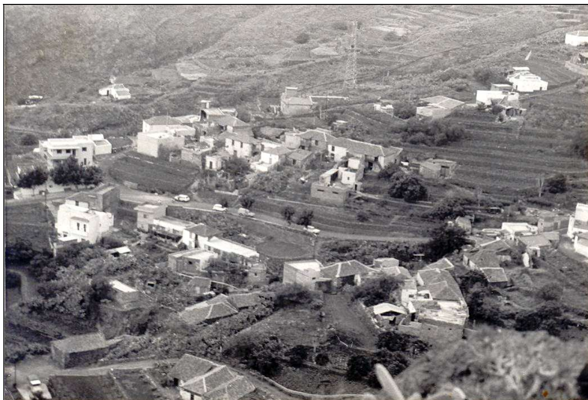
Igueste de Candelaria contó a partir de 1952 con un nuevo casino, la Sociedad “Cultural Recreativa”.