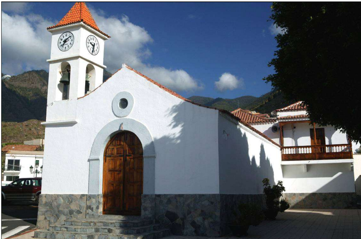
En la “Plaza de la Ermita” de Igüeste se jugaba a la pelota, a pesar de la prohibición municipal, lo que daría lugar a varias denuncias del delegado de la Alcaldía en dicha localidad.

Como curiosidad, en diciembre de 1934 se constituyó en Santa Cruz de Tenerife otro equipo de fútbol con un nombre semejante, “C.D. Champion” 15 . También existía un vapor “Champion”, que en septiembre de 1930 se hundió cerca del puerto de Brest, en Francia, a causa de un fuerte temporal 16 .