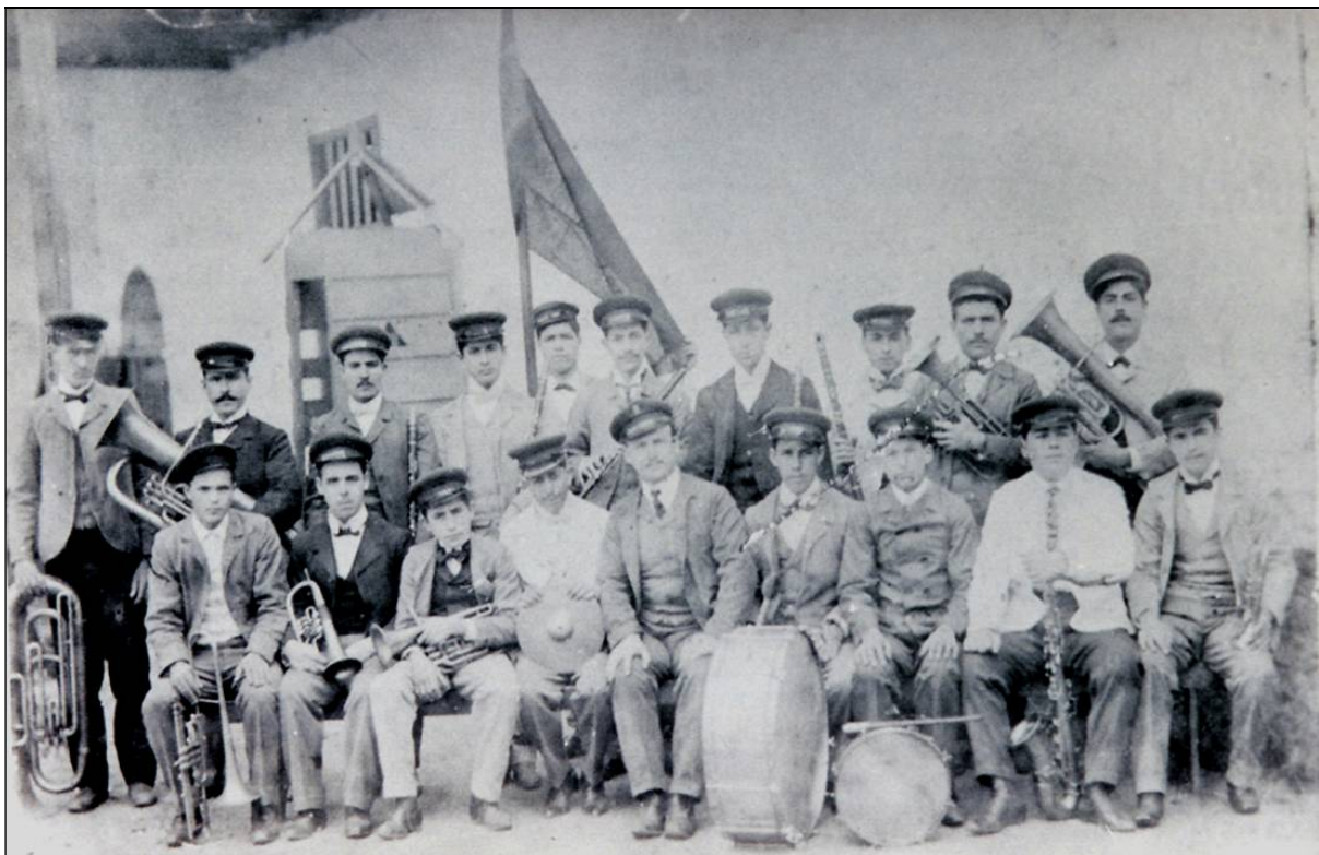
La Banda de Música de Güímar en los albores del siglo XX, aún sin uniforme pero con gorra.