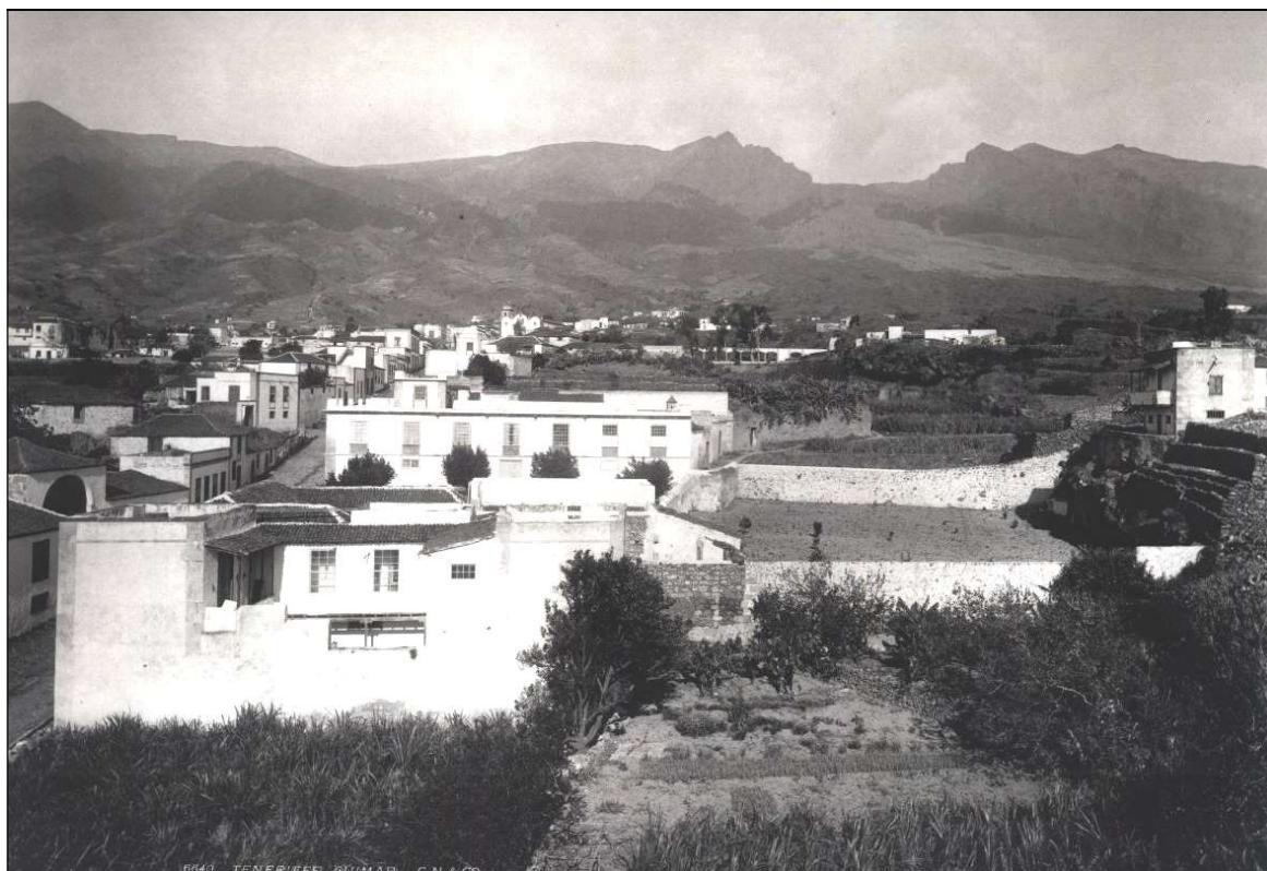
En Güímar se fundó hacia 1853 la primera banda de música del Sur de Tenerife.