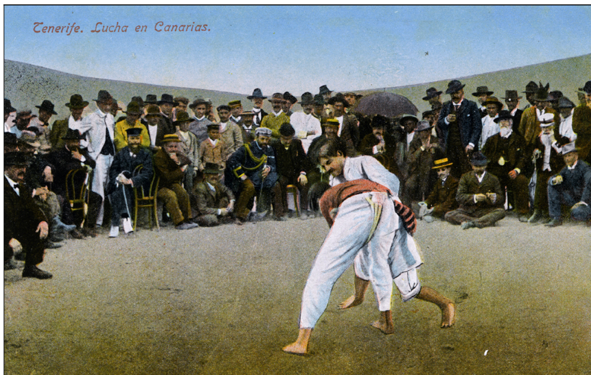
Encuentro de lucha canaria en Tenerife, a principios del siglo XX.

conocen eran hermanas o madres de célebres puntales, con los que habitualmente entrenaban, aprendiendo y perfeccionando mutuamente las principales mañas.