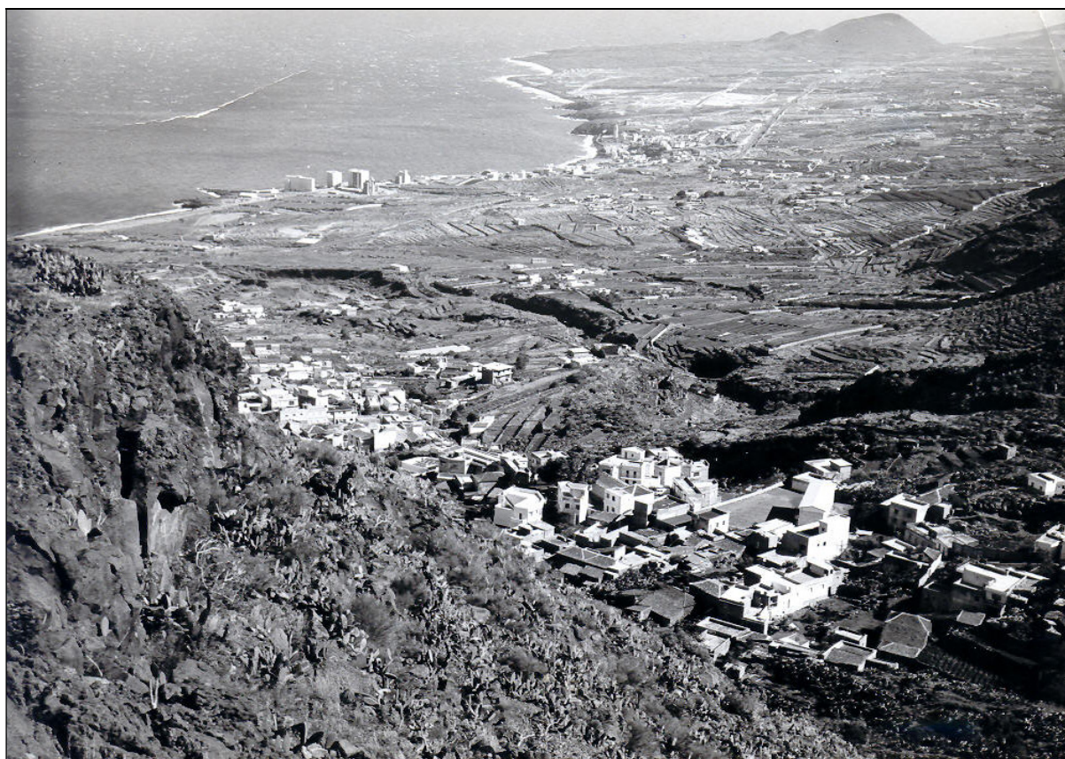
La primera cartería estaba situada en la parte baja del pueblo de Igueste, en la Carretera General del Sur.