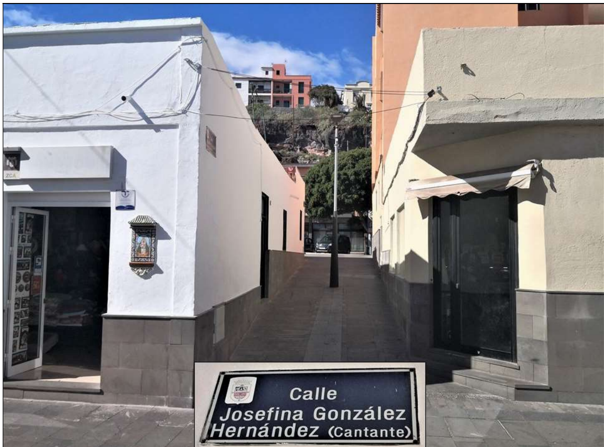
Calle peatonal dedicada a doña Josefina González Hernández en la villa de Candelaria.

Descanse en paz y reciban sus desconsolados padres y demás familiares nuestro más sentido pésame. 9