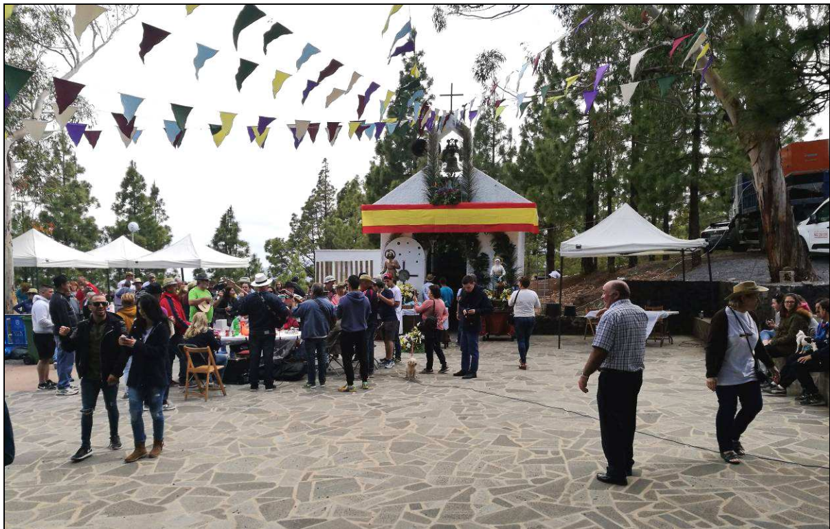
La Romería de Los Brezos, en 2018.

Con motivo de la inauguración de la pista construida entre Araya y Chafa, en 1978 se celebró una fiesta comunitaria en el monte de Los Brezos, en el transcurso de la cual se decidió organizar una romería anual hasta dicho lugar, que fomentara la convivencia vecinal. De este modo, tras cederse los terrenos y construirse por los vecinos una capilla, a la vez que se adquirió la imagen del Santo titular, en 1979 se organizó la primera romería de Araya en honor de San Isidro Labrador, a la que con el paso del tiempo se unió Santa María de la Cabeza; y en el presente año se celebró la número 40, con lo que ya ha adquirido una sólida madurez y un carácter tradicional. Hoy es un encuentro obligado para los vecinos del municipio, sobre todo de Araya, que cada mes de mayo se reúnen para disfrutar de ese bello entorno natural y pasar unas horas de confraternidad entre familiares y amigos.