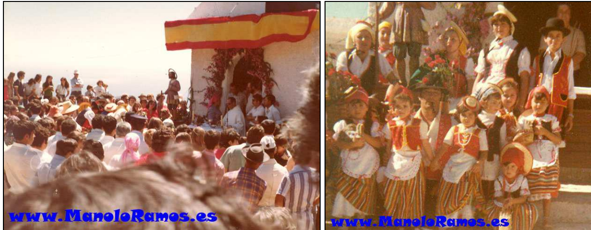
Primera romería a Los Brezos, tras la construcción de la ermita y la adquisición de la imagen de San Isidro Labrador, en 1979.