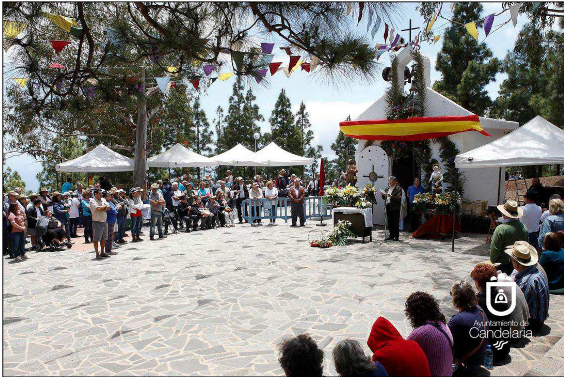
Actos conmemorativos celebrados en 2018, con motivo de la romería nº 40 de Araya a Los Brezos.

historia religiosa de Araya y, en especial, a la Romería de Los Brezos en honor de San Isidro Labrador y Santa María de la Cabeza.