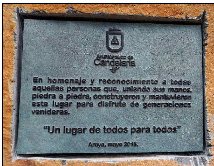
Placa colocada por el Ayuntamiento en la plaza de Los Brezos en 2018, como homenaje y reconocimiento a las personas que construyeron y mantuvieron dicho lugar.

A continuación se rindió homenaje a los promotores de esta festividad, a propuesta de la comisión, en el que las autoridades municipales descubrieron una lápida en la plaza, con el texto siguiente: “Ayuntamiento de Candelaria / En homenaje y reconocimiento a todas a todas aquellas personas que, uniendo sus manos, piedra a piedra, construyeron y mantuvieron este lugar para disfrute de generaciones venideras. / «Un lugar de todos para todos» / Araya, mayo 2018” .