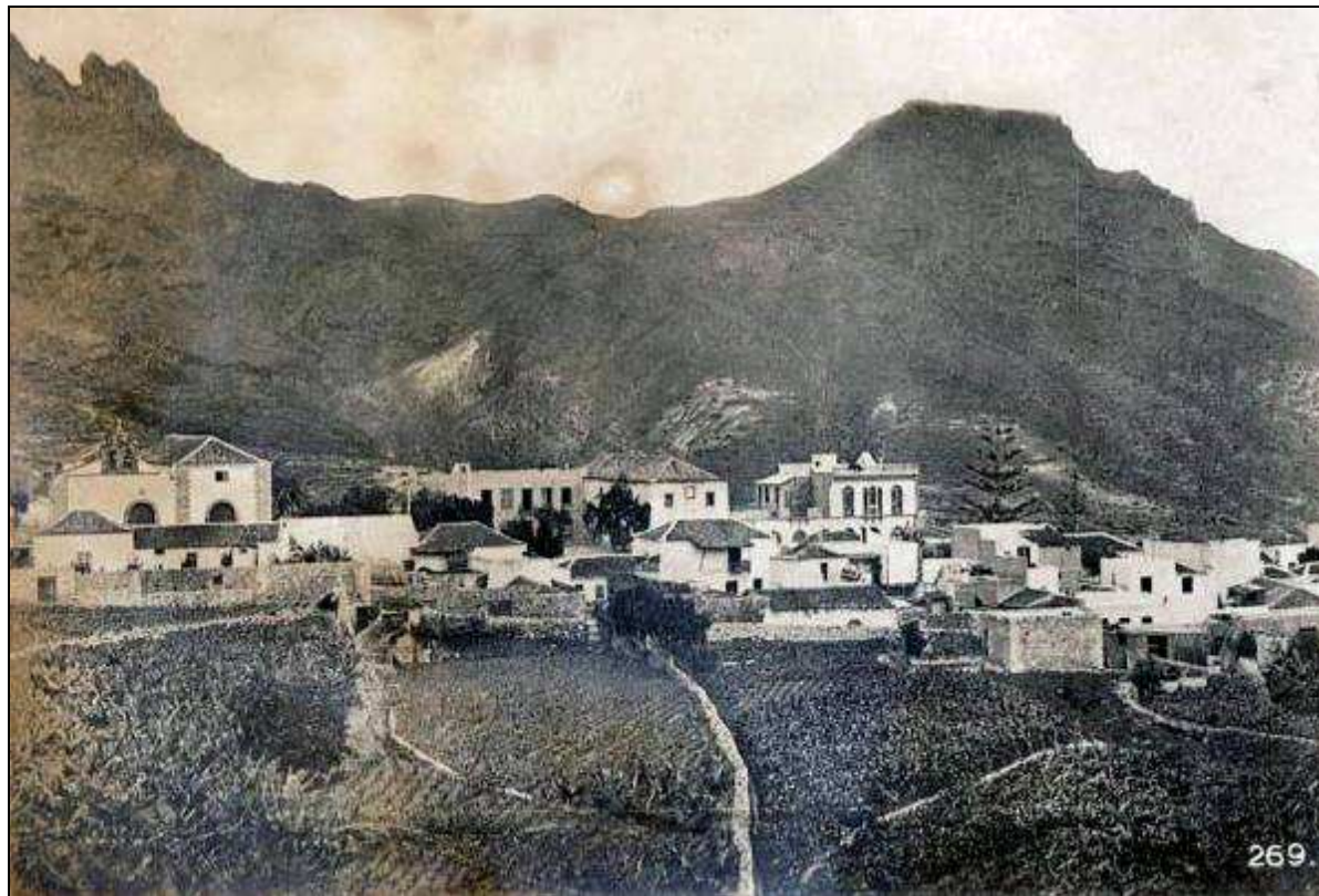
Don Román vivió durante algunos años en Adeje, como propietario y maestro particular.

A mediados de 1911 volvió a solicitar el nombramiento de juez municipal de Adeje, junto a otros siete vecinos de dicha villa 23 , pero tampoco tuvo éxito.