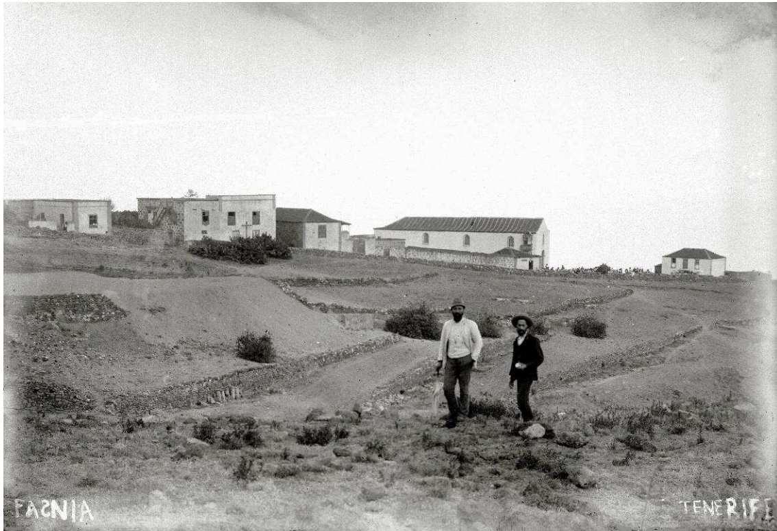
Fasnia, a finales del siglo XIX. [Imagen del Centro de Fotografía “Isla de Tenerife”].

En 1876 se hizo un inventario del Juzgado municipal de Fasnia. Una década después, el 20 de enero de 1887, el fiscal municipal de esta localidad, don Francisco Marrero, se dirigió al juez de Instrucción del partido de Santa Cruz de Tenerife para manifestarle que no había podido efectuar la inspección de los libros del Registro Civil, tal como se le había ordenado, por la oposición del encargado del mismo: