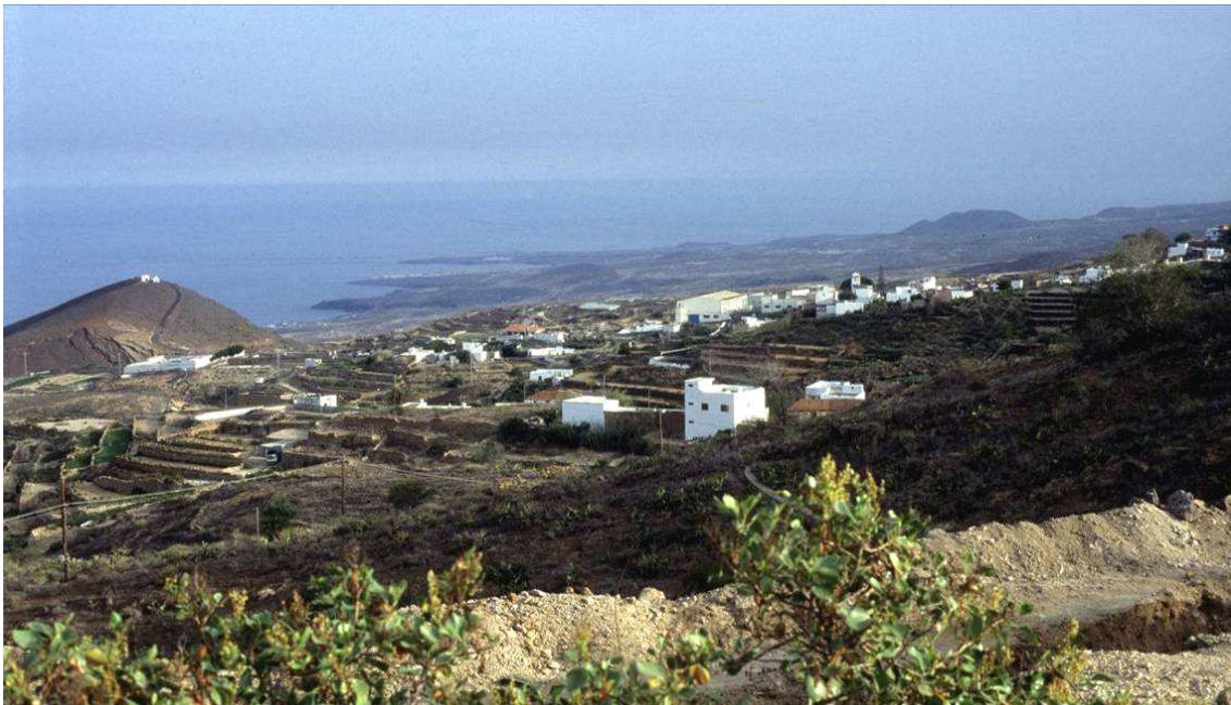
El pueblo de Fasnía, con su simbólica montaña.