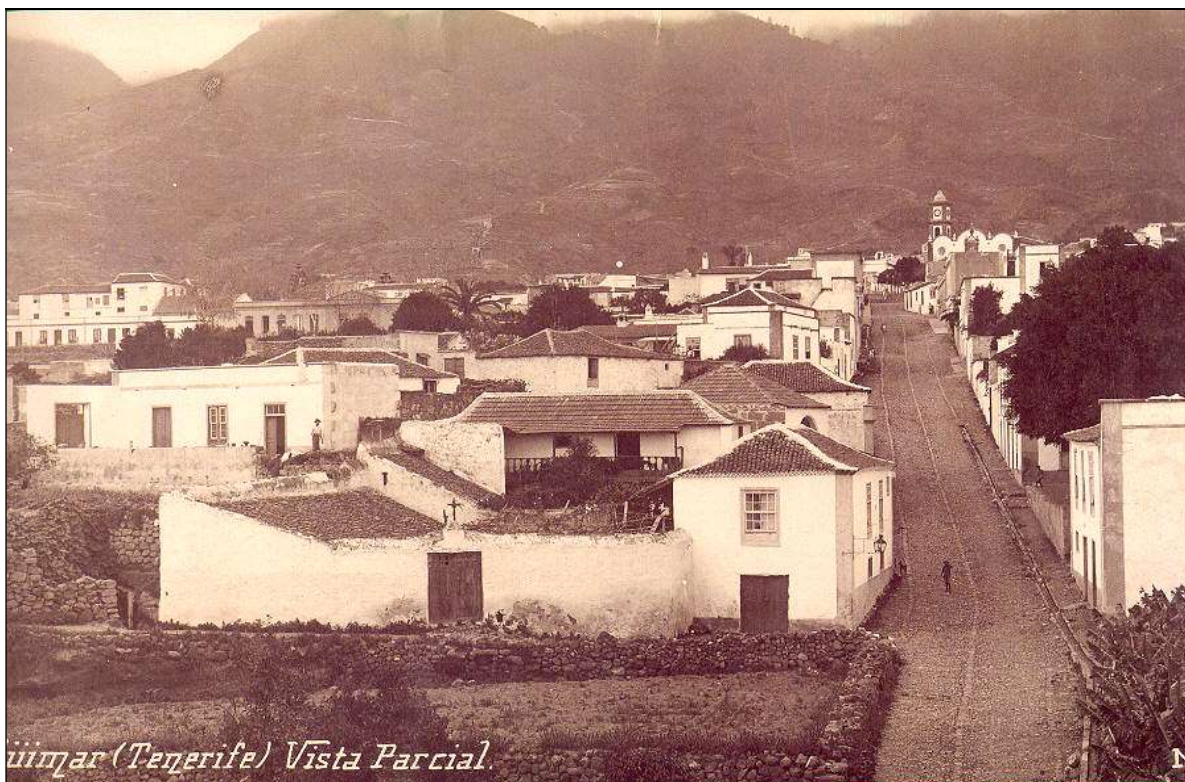
La entonces villa de Güímar disfrutó de esta sociedad durante unos diez años, en los que compartió su actividad con el Casino de Güímar.

después del paseo grandes bailes como remate de estos animados festejos 31 . Lo mismo ocurriría el 8 de septiembre de 1924, pues el programa de esas mismas fiestas de la Virgen del Socorro concluía destacando los bailes en las sociedades: “dándose por terminados estos festejos con animados bailes en los centros y casinos de recreo de esta localidad” 32 . De estas notas podría desprenderse que aún existía el Casino “La Unión”. Pero después de esa última fecha no existe ninguna referencia a esta sociedad, por lo que es probable que se disolviese en ese mismo año, tras una década de intensa actividad cultural, social y recreativa.