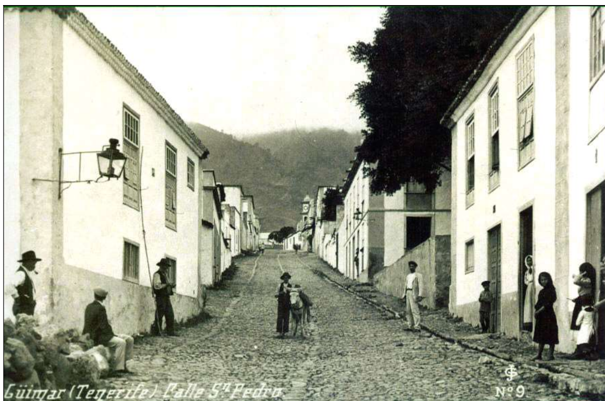
El Casino “La Unión” sirvió de lugar de recreo a los güímareros durante una década.

De empuje y circunstancias ¡viva la madre o nodriza que te dió la harina lactea y ¡ole, con ole y con ole! y ¡bendita sea tu alma! 15