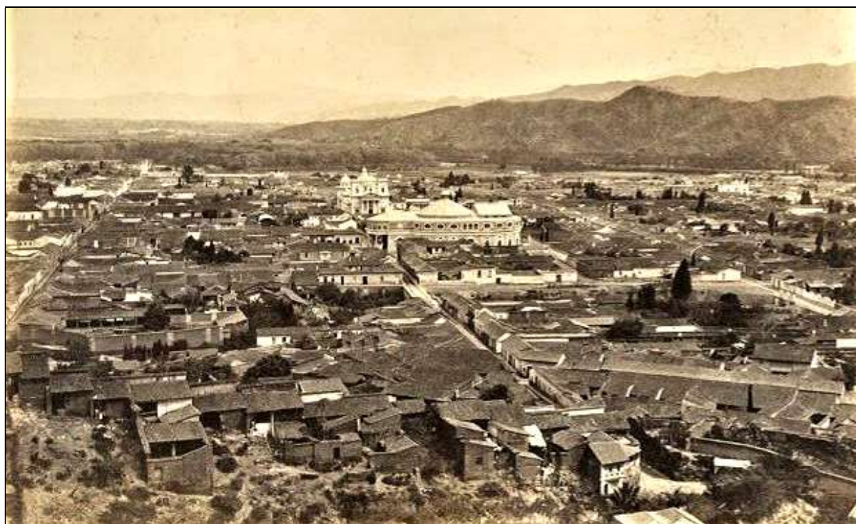
El clérigo don Andrés Afonso Montesdeoca emigró a Caracas, donde falleció.