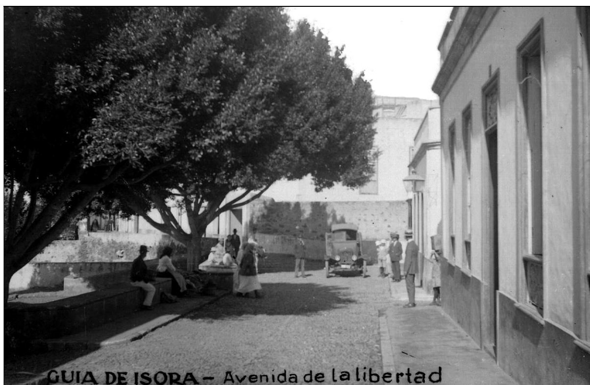
GUÍA DE ISORA – Avenida de la libertad