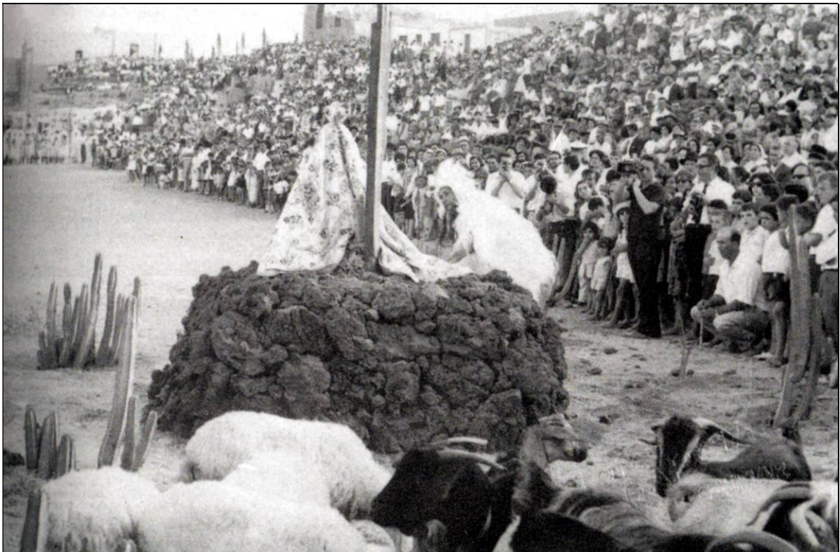
Desde su incorporación, la “ Ceremonia ” ha sido uno de los actos más esperados y concurridos de la fiesta de Nuestra Señora del Socorro.