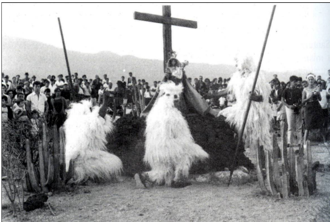
La “Ceremonia guanche” se incorporó a las fiestas de la Virgen del Socorro en 1872.

Desde mediados del siglo XIX, los vecinos de Güímar querían incorporar a la festividad de El Socorro la representación de la aparición de la Virgen a los guanches, como se venía haciendo en la festividad de Candelaria por lo menos desde mediados del siglo XVIII; para ello, se apoyaban en que la playa de Chimisay era el auténtico lugar de aparición y, por lo tanto, el mejor lugar para que se efectuara la “Ceremonia”. Pero el informe negativo del párroco de Santa Ana de Candelaria, que al igual que ocurrió con unas polémicas postales 2 alegaba que sólo la Virgen de Candelaria podía tener guanches en su festividad, hizo que el obispo de la Diócesis prohibiese repetidamente dicha representación. Sin embargo, los güímareros siguieron intentándolo hasta que lo consiguieron