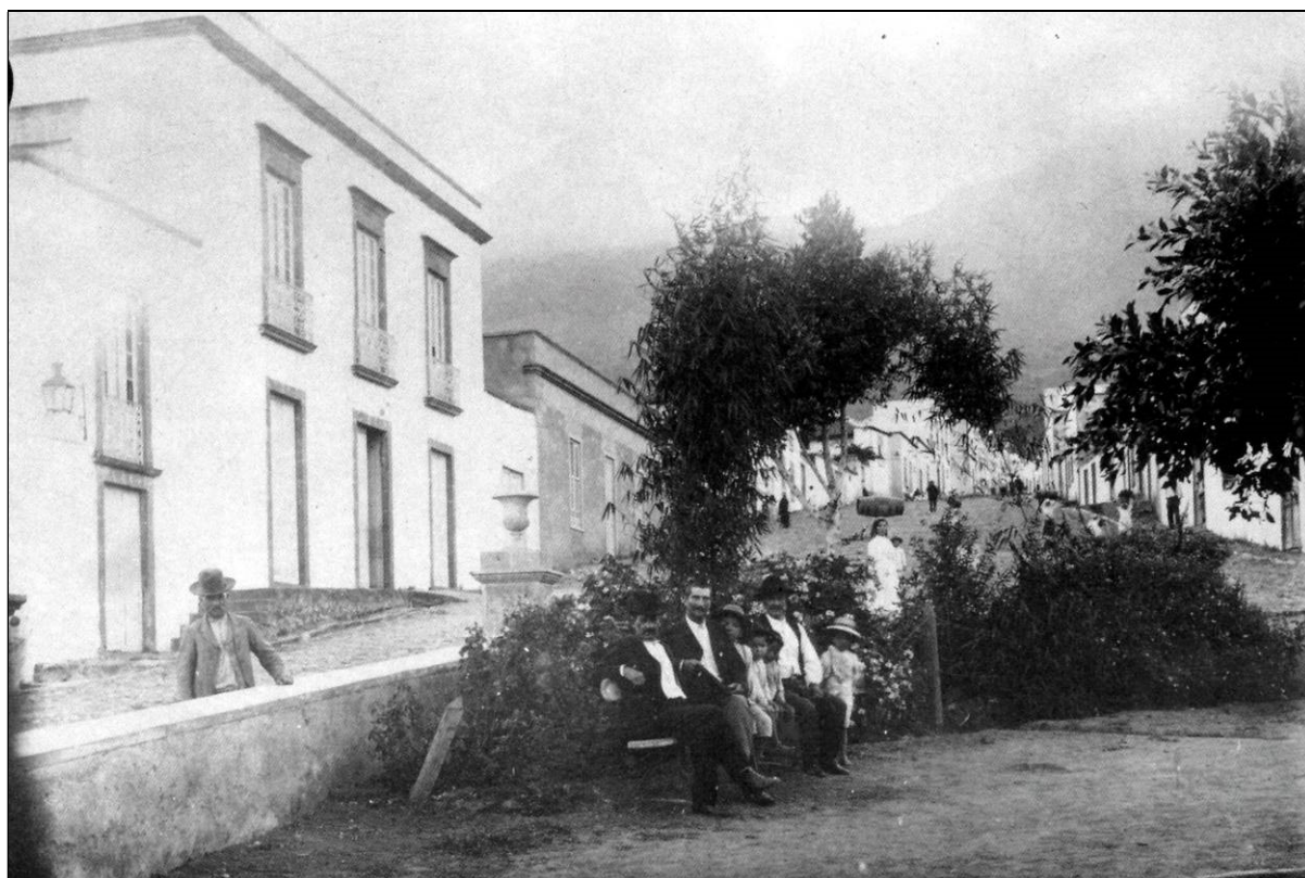
Arafo en el primer tercio del siglo XX.