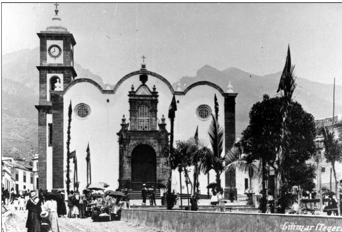
La plaza de San Pedro en fiestas.

Nos complace en dejar consignado que tanto el señor Gobernador civil, como la representación del Comandante general de Canarias, a su llegada a esta Villa y al emprender el viaje de regreso a esa capital, fueron objeto de afectuosas demostraciones de respeto y simpatía. 2