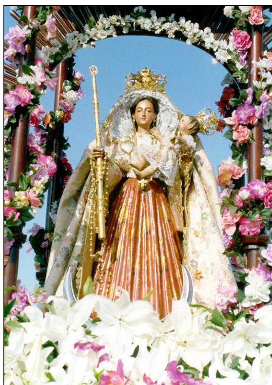
Nuestra Señora del Socorro.

A pesar de lo que había dispuesto el gobernador eclesiástico de la Diócesis, al año siguiente la fiesta volvió a sus días tradicionales, 7 y 8 de septiembre, como han continuado hasta el presente.