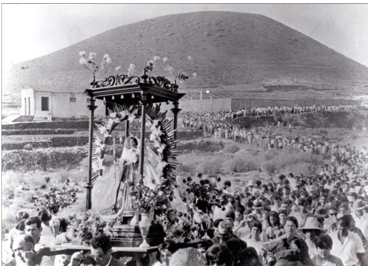
Antigua Romería de la Virgen del Socorro.

A las cuatro de la tarde, regresará a su parroquia, siendo esperada en la Asomada, mientras se juega el típico “pares y nones”. 19