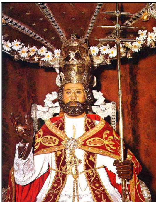
San Pedro Apóstol, patrón del municipio de Güímar.

Las fiestas Patronales de Güímar en honor a San Pedro Apóstol se celebran en esta localidad, sin interrupción, desde comienzos del siglo XVII. Tradicionalmente, la celebración de la festividad se ha mantenido en los días principales, del 27 al 29 de junio, pero en las últimas décadas los actos han sobrepasado dichos días y se han repartido durante varias semanas. No obstante, desde mediados del siglo XIX hasta el presente, período del que tenemos información documental, en varias ocasiones se suprimieron los actos populares y solo se celebraron los religiosos, por motivos de especial relevancia. Curiosamente, no tenemos constancia de que éstos se suspendieran ni a causa de la Guerra de Cuba (1895-1898), ni de la I Guerra Mundial (1914-1918), ni de la pandemia de la mal llamada “Gripe española” (1918-1920), pero sí con la Guerra Civil española, como se verá más adelante.