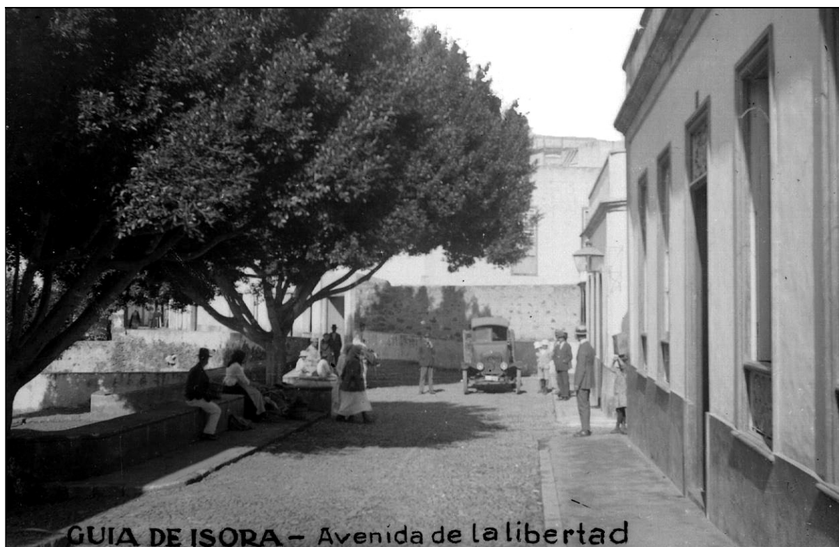
GUÍA DE ISORA – Avenida de la libertad