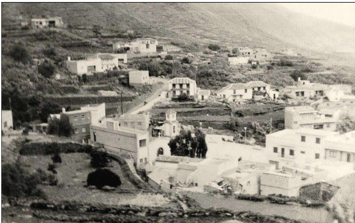
La Sociedad “C.D. Cárdenes” animó la vida deportiva y recreativa de Barranco Hondo, por lo menos desde 1943 hasta 1955.