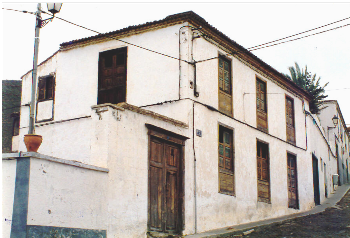
Casa de la familia Frías en Granadilla de Abona.