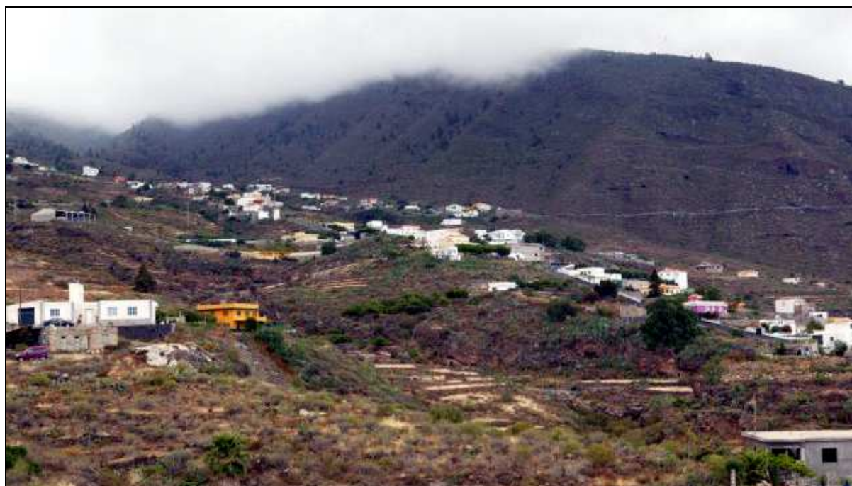
Araya de Candelaria, con La Ladera de La Mesa al fondo.