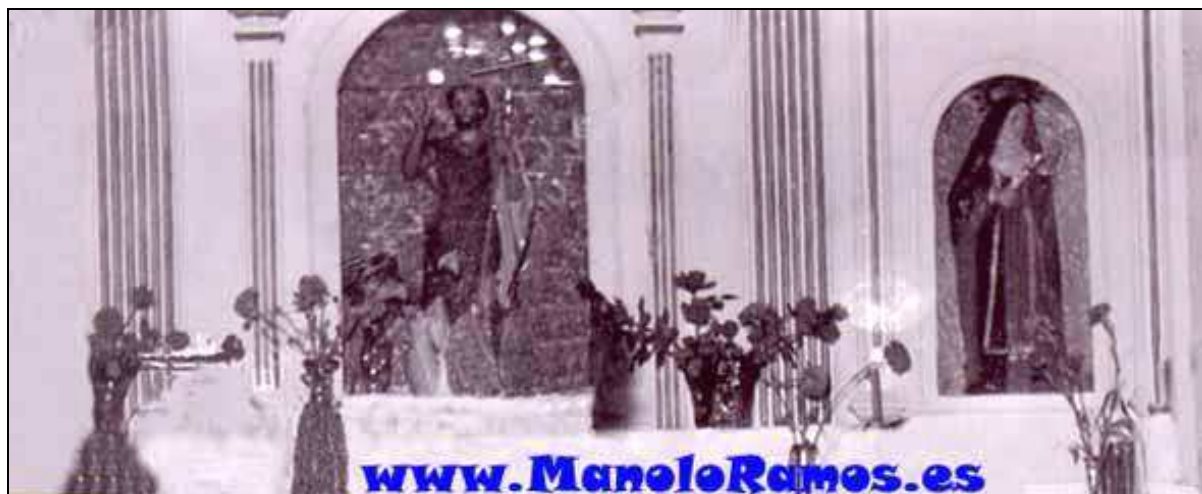
Hornacinas de San Juan y Santa Rita (imagen antigua) en la ermita de Araya, tras su ampliación.

dependía por entonces el pago de: “Araya, con 667 habitantes, a tres kilómetros de distancia, por camino de herradura, con dos escuelas y ermita de San Juan Bautista” 41 .