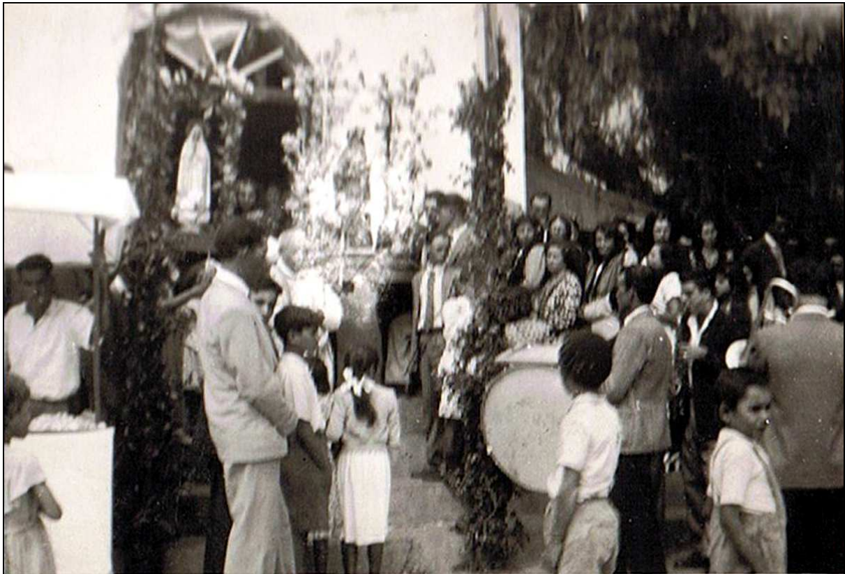
Una procesión con la Virgen de Fátima y Santa Rita ante la antigua ermita de Araya, en los años cincuenta.

la concentración que se planteaba en Candelaria como clausura de la misión estuviese más nutrida, como así resultó.