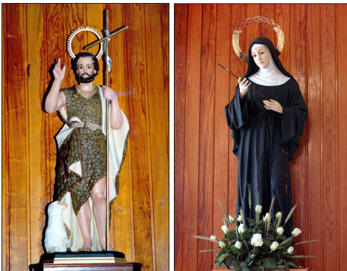
La imagen titular de San Juan Bautista (siglo XIX) y la actual de Santa Rita (que no es la original).

Ese antiguo templo, levantado con piedra y barro, tenía tejado a dos aguas, una escasa superficie, de aproximadamente 18 m 2 (tres metros de ancho y seis de largo), y una altura de 3,50 m. El altar estaba presidido por las dos imágenes mencionadas, San Juan y Santa Rita, que hoy siguen presidiendo el templo parroquial. 11