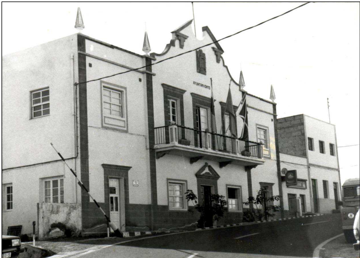
El Ayuntamiento viejo fue la sede del Patronato para la Protección y Fomento de las Bellas Artes “Amigos del Arte de Fasnía”, antes de la reforma que le dio su conocido aspecto.