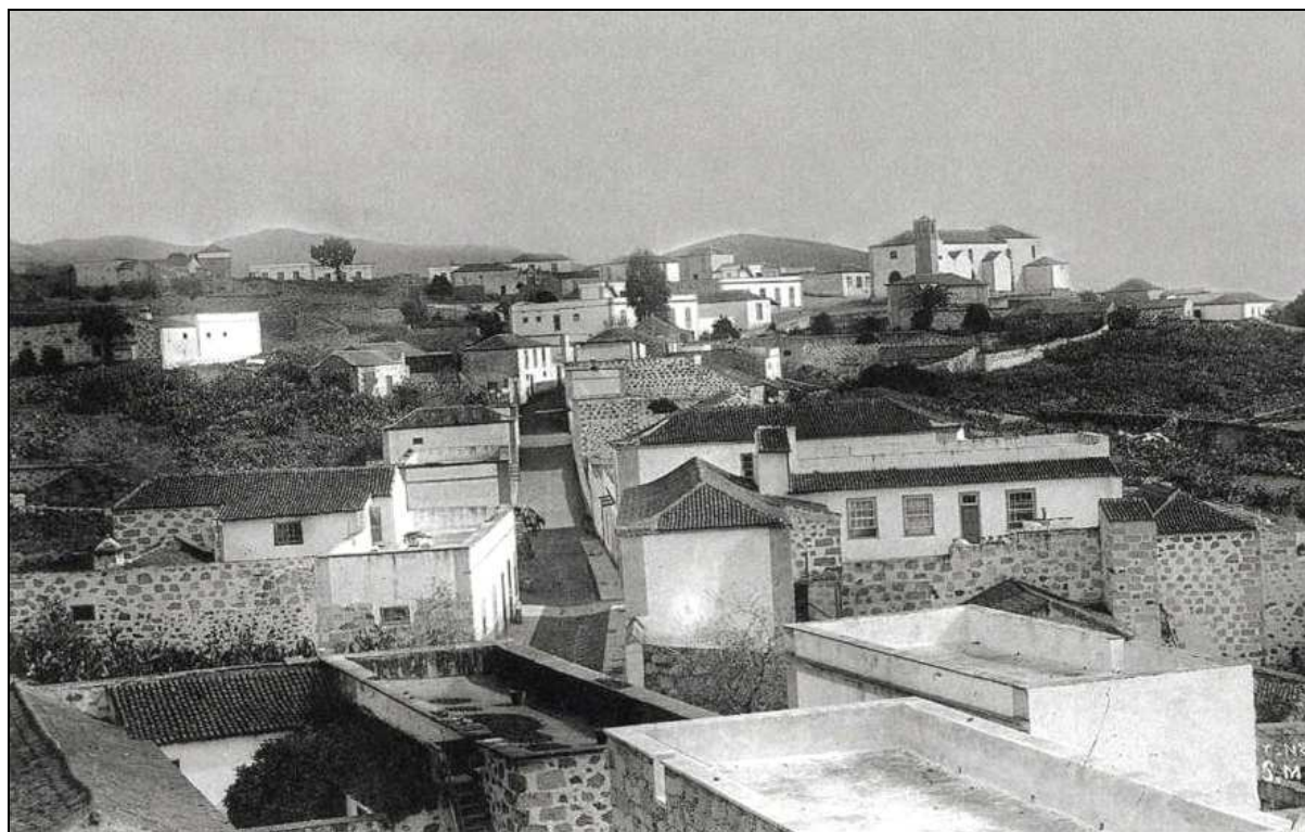
El Casino “La Unión” animó la vida cultural y recreativa de San Miguel de Abona, durante más de 26 años, en dos etapas.