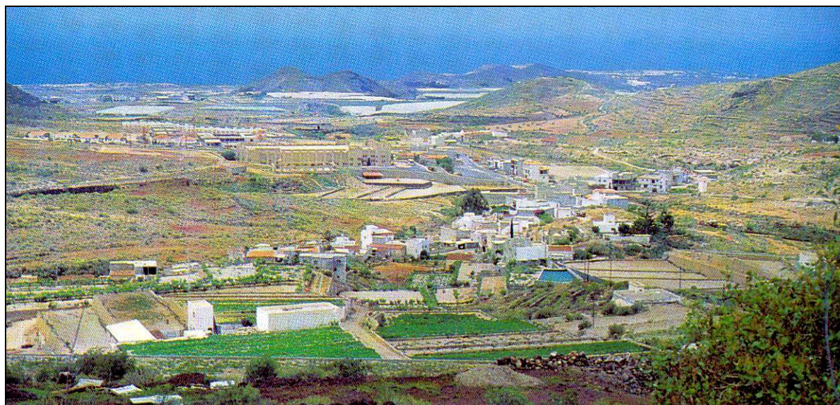
El último destino de doña Geroncia fue la escuela de Aldea Blanca, en su municipio natal, que regentó durante ocho años.

continuó durante nueve meses, hasta el 6 de junio de 1920, ahora con un sueldo anual de 1.000 pesetas.