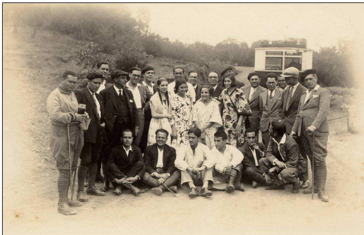
El traslado de los equipos de fútbol desde Santa Cruz hasta Vilaflor era una auténtica excursión, lo que constituía un atractivo añadido. [Imagen del Centro de Fotografía “Isla de Tenerife”].

El día 2 de octubre próximo, segundo día de la fiesta de Arona, volverán a enfrentarse estos dos equipos en el campo de aquella localidad, donde reina gran entusiasmo por este encuentro. 7