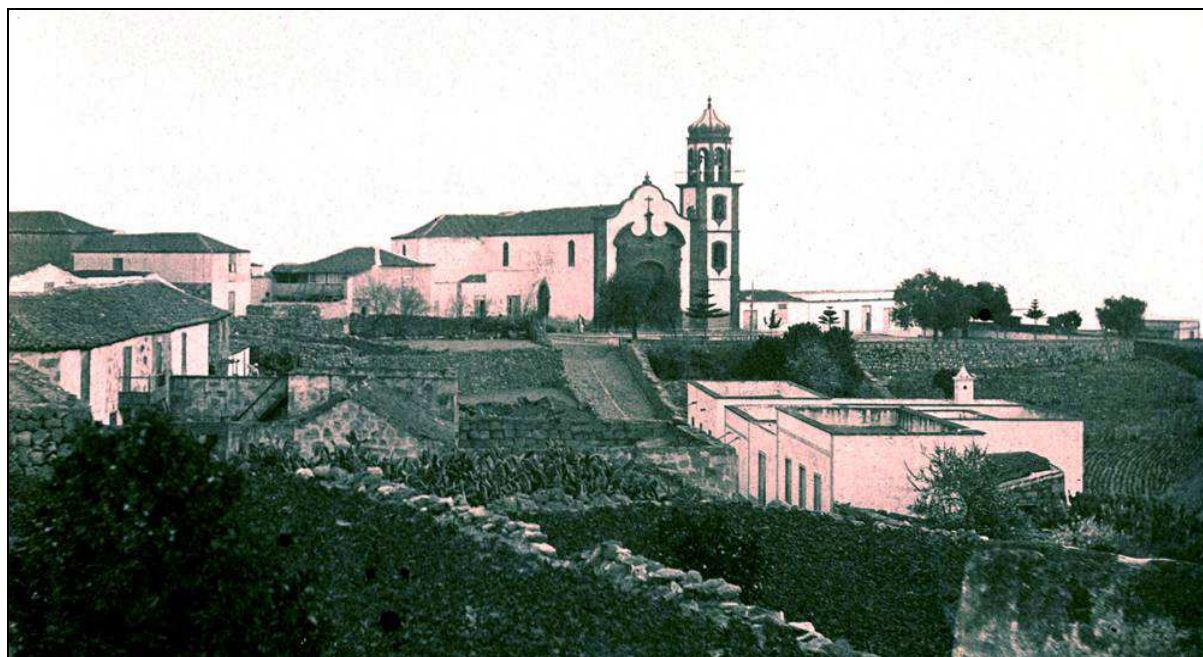
Arico contó con Juzgado Municipal desde 1870 hasta 1946.

El Juzgado de Arico tuvo que intervenir inicialmente en todos los problemas de orden público que se producían en el término municipal, aunque los asuntos más graves los desviaba luego al Juzgado de Primera Instancia e Instrucción, primero del partido de La Orotava y luego del de Granadilla. Los casos más frecuentes en los que tuvo que intervenir el Juzgado de Arico fueron: la introducción de rebaños de ganado en fincas ajenas; los embargos de propiedades; los robos o hurtos; las reyertas o riñas vecinales; y algunos homicidios.