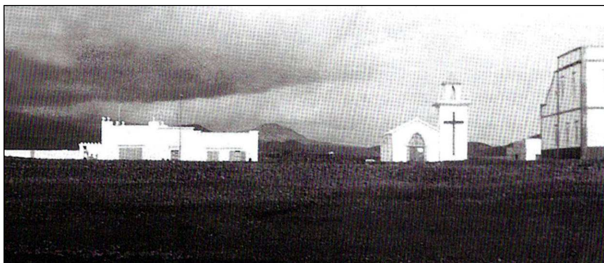
La primitiva ermita de San Casiano de Las Galletas, junto a la primera escuela de la localidad. [Foto reproducida por Carmen Rosa Pérez Barrios (2006) 5 ].

Con muy ligeras variantes, ese mismo día publicó el programa el diario Hoy , siendo la única diferencia que el partido de fútbol tendría lugar entre el “Villamar F. C.” y “ un acreditado ‘onze’ ” 3 . Lo mismo recogió La Prensa el 10 de ese mismo mes, con mínimas diferencias en la redacción, destacando la omisión de “ los ‘guayabos’ veraneantes ” en la exposición de mantones de Manila 4 .