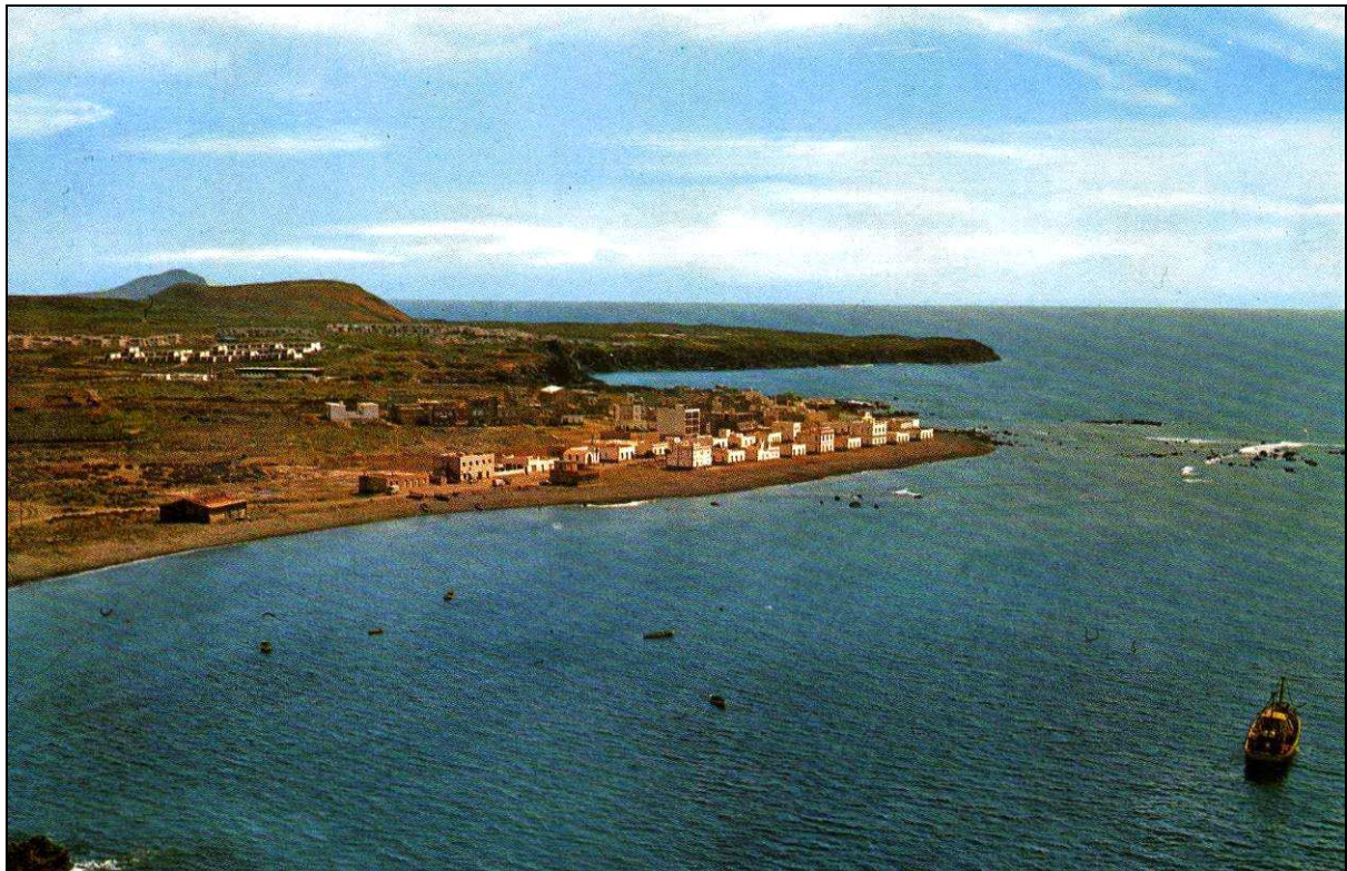
Antigua vista panorámica del pueblo de Las Galletas, con la primitiva ermita en la parte izquierda.