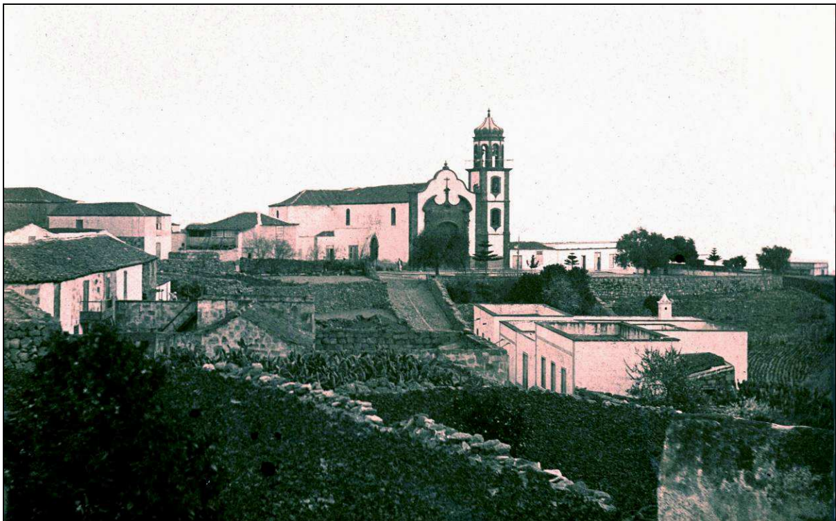
El municipio de Arico ha contado con Juzgado desde 1856.