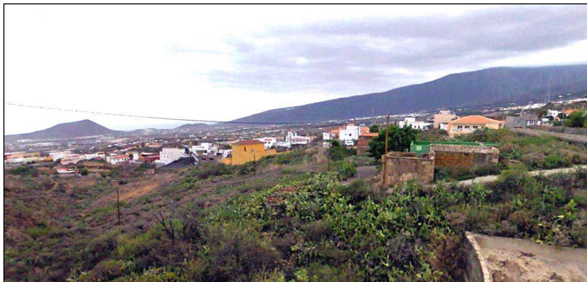
El pueblo de Malpaís de Candelaria contó con varias orquestas de baile en los años cincuenta.

A pesar de tratarse del núcleo más pequeño de las medianías de Candelaria, el pueblo de Malpaís llegó a tener una interesante tradición musical, sobre todo ligada a las orquestas de baile. Primero fueron músicos aislados los que amenizaban bailes en casas particulares, con sus instrumentos de cuerda. Luego, en los años cincuenta y sesenta, se constituyó un cuarteto y cuatro orquestas organizadas que ya incorporaron instrumentos de viento; las integraban músicos de la propia localidad, donde tenían su sede y ensayaban, más algunos del vecino pueblo de Las Cuevecitas; y sus nombres fueron: “Río de Oro”, “Buenos Aires”, “Club” y “Coral”. No duraron muchos años, pero llevaron el nombre de Malpaís de Candelaria por la geografía tinerfeña.