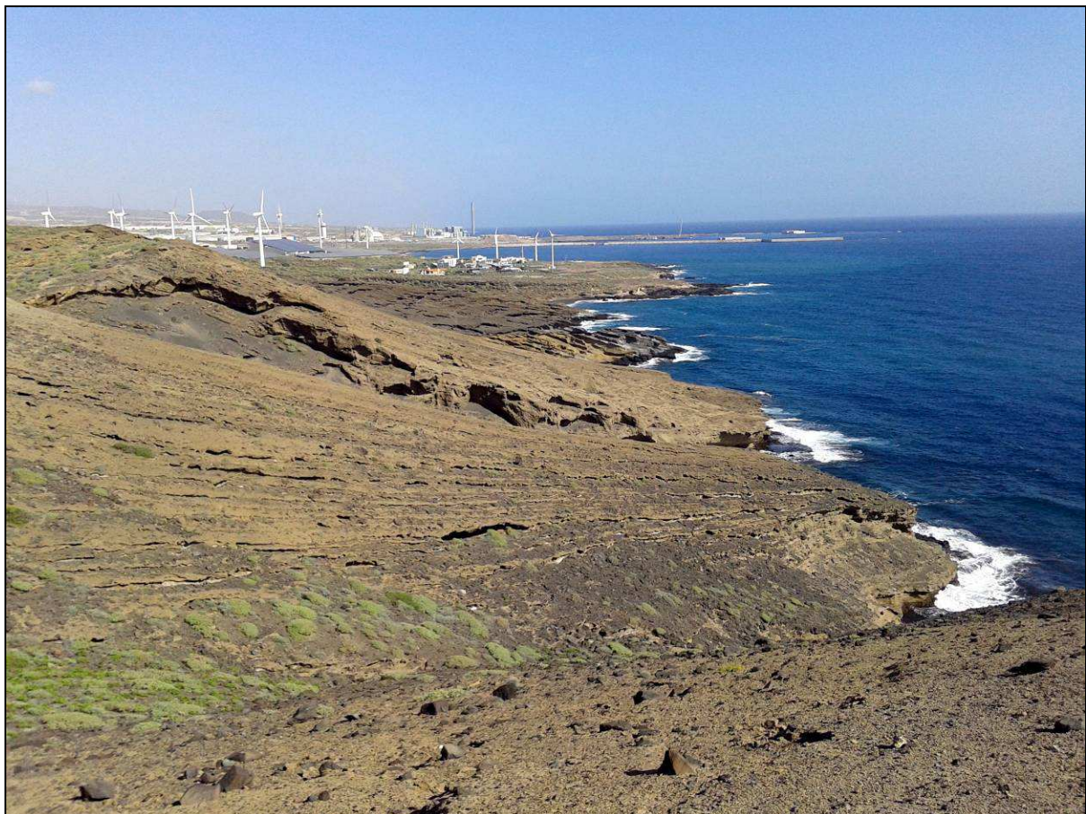
La Punta del Camello, al fondo y desde Montaña Pelada, donde hoy se construye el puerto de Granadilla y en la que encalló el vapor frutero “Ajax”.