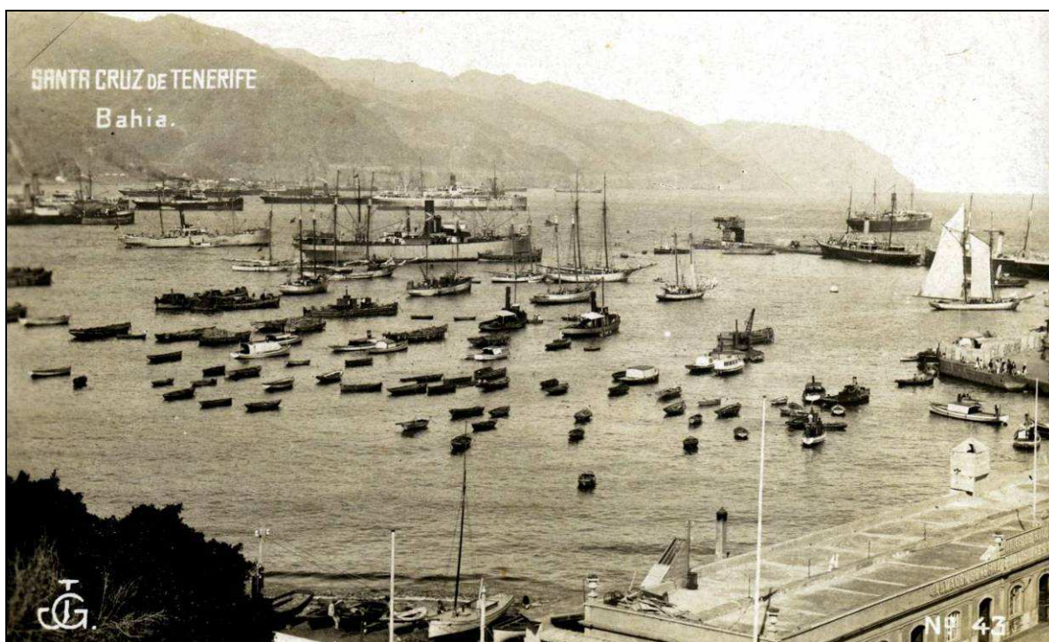
Puerto de Santa Cruz de Tenerife, con algunos vapores y veleros, desde el que salió el “Ajax” hacia el Sur de Tenerife, en su último viaje.

El miércoles 12 de julio de 1905 se recibió un telegrama en la Comandancia de Marina de Tenerife, en el que se informaba de que el vapor de cabotaje frutero “Ajax” había encallado en la madrugada de ese día, con motivo de un fuerte temporal, en la Punta del Camello, cerca de Montaña Pelada, en la costa de Granadilla de Abona; había salido del puerto de la capital tinerfeña en la noche del día anterior. No hubo ninguna víctima, pues los tripulantes y pasajeros lograron ser rescatados, si bien con grandes dificultades a causa de la marejada y el viento reinante, por el vapor “Tenerife”, que los trasladó a la capital. Luego éste barco volvió al lugar del siniestro, llevando a bordo al cónsul inglés y a un agente de la compañía aseguradora del barco siniestrado. Las operaciones de salvamento del casco y enseres, que se encargaron al remolcador “Britania”, se vieron retrasadas por el mal tiempo. Al final, el barco encallado resultó irrecuperable, por tener la quilla y el fondo completamente destrozados, por lo que se optó por subastar al mejor postor la maquinaria y todos los enseres que se pudiesen aprovechar del mismo, en el lugar del naufragio.