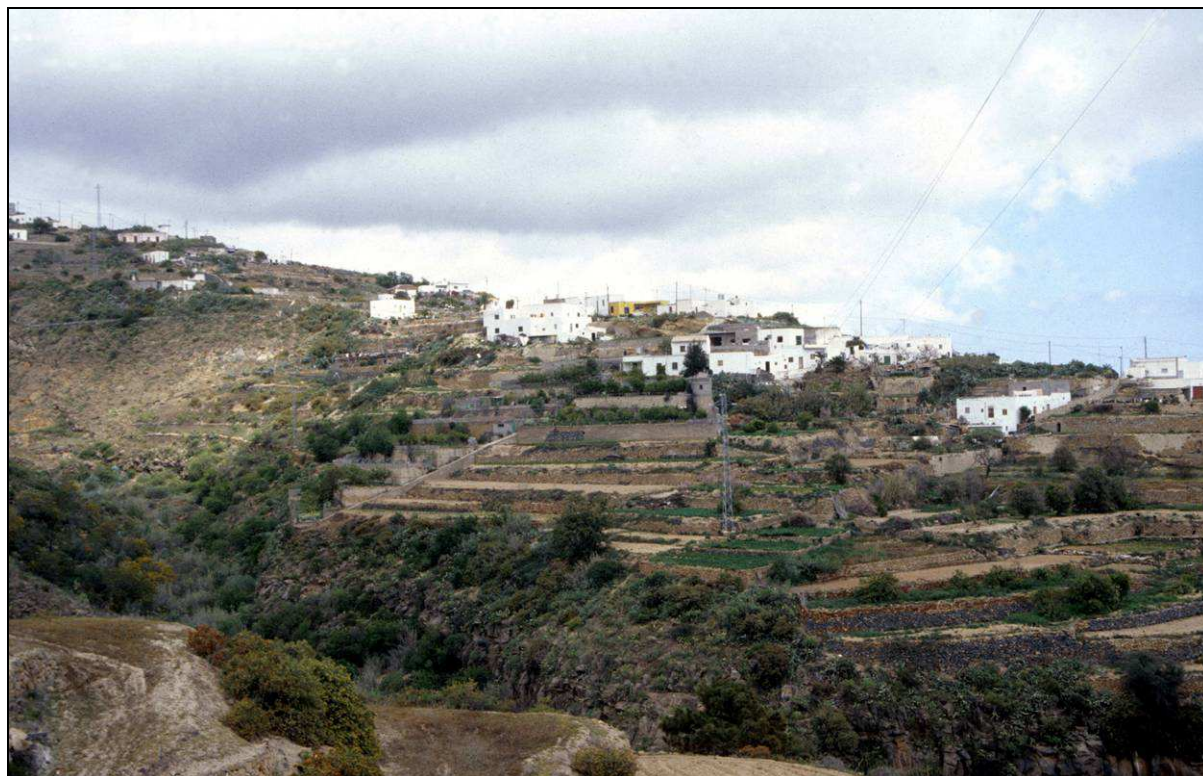
Sabina Alta contó con escuelas desde 1928 hasta 1974.

A petición del Ayuntamiento de Fasnía, por Real Orden del 10 de diciembre de 1927, se creó provisionalmente la escuela mixta de Sabina Alta, que debía ser atendida por un maestro; fue ratificada por otra Real Orden del 19 de abril de 1928, en que se creó con carácter definitivo. Pocos años más tarde, según Orden publicada en la Gaceta de Madrid el 24 de noviembre de 1931 se desdobló dicha escuela, lo que se había venido solicitando desde su creación; de ese modo, la unidad existente fue transformada en escuela unitaria de niños y se creó la unitaria de niñas, que curiosamente se ubicaría en La Sombrera, a pesar de que siempre usó el nombre oficial de la primera localidad. Ambas escuelas, que siempre estuvieron instaladas en salones alquilados, fueron suprimidas por Orden Ministerial del 5 de diciembre de 1974, a causa de la disminución del censo escolar.