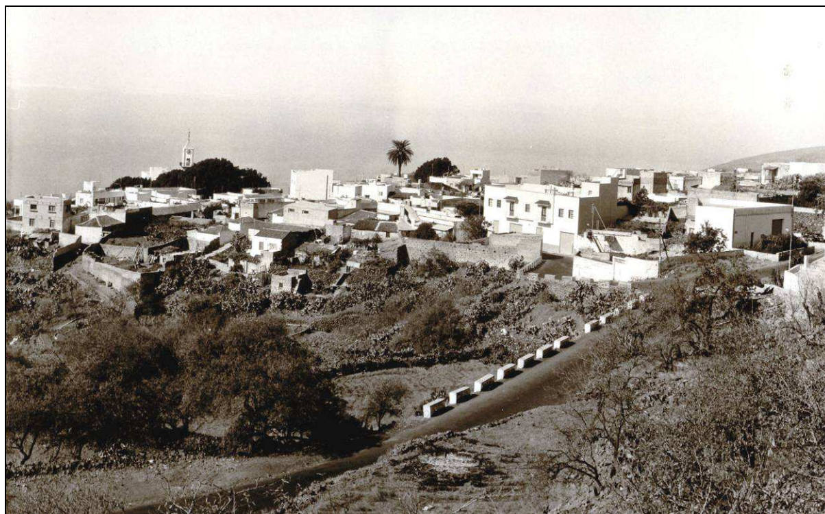
El pueblo de Chío (Guía de Isora), que contó con la Sociedad “Centro El Porvenir”, por lo menos de 1928 a 1932.

El presente artículo está dedicado a las fiestas de Chío (Guía de Isora), pero solo en el corto período comprendido entre 1928 y 1940, que conocemos gracias a la prensa de la época. Al margen de las festividades religiosas generales, incluida la Navidad y la Semana Santa, por entonces se celebraban en dicho pueblo dos fiestas principales: la primera en enero, en honor de San Antonio Abad, limitada a un día; y la segunda en junio, en honor de San Juan y la Virgen de la Paz, que se extendía a tres días; como era normal, en ellas se combinaban los actos religiosos con los populares. Pero llama la atención la existencia de una sociedad de recreo, el “Centro El Porvenir”, que por lo menos de 1928 a 1932 tuvo un destacado protagonismo en la vida local, sobre todo en la celebración de bailes.