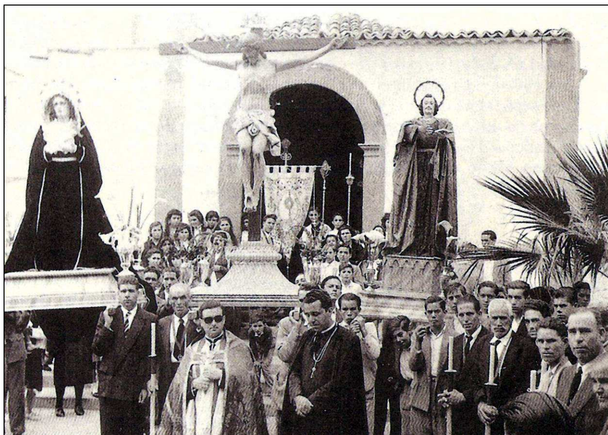
La procesión de Semana Santa en 1957, en la plaza de San Juan de Chío. [Foto reproducida por Carmen Fraga (1994)].

A continuación se señaló que: “ El mismo día se inauguró la nueva parroquia de San Juan Bautista de Chío, con gran regocijo de sus feligreses ” 9 .