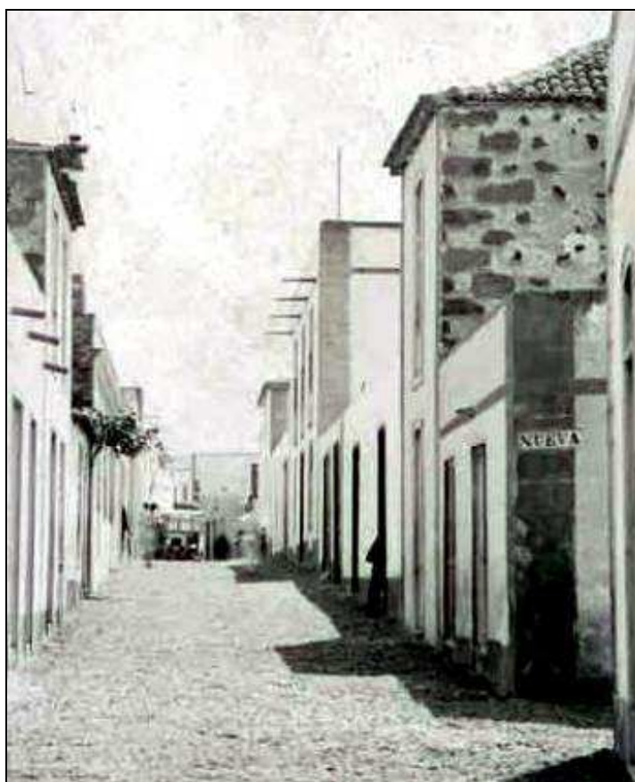
A la derecha, comienzo de la calle Nueva, en la que vivió y murió don José. [Imagen del Centro de Fotografía "Isla de Tenerife"].

Lo cierto es, que el 26 de enero de 1891 don José vivía en su pueblo natal, al ser designado interventor para la mesa electoral de la sección 1ª (Sur) de Guía de Isora, en las próximas elecciones de diputados a Cortes, por la Junta Provincial del Censo Electoral de Santa Cruz de Tenerife, por lo que debió tener un cierto compromiso político 16 .