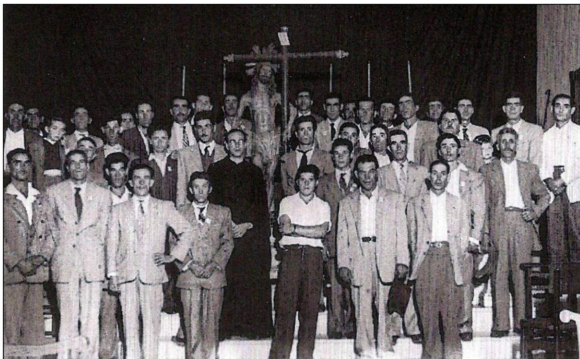
Contribución de los obreros de Arona con un día de salario para el trono procesional del Cristo de la Salud, el Viernes Santo de 1952.