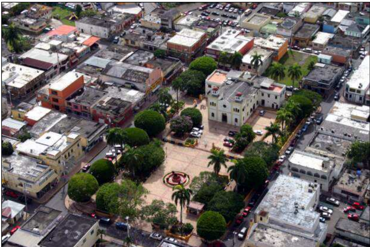
La localidad de Cidra (Puerto Rico), de donde don Ricardo fue párroco. [Foto de internet].

Luego el Sr. Díaz Delgado decidió emigrar a Puerto Rico, la tierra de su madre, en la que regentó durante seis años una parroquia del municipio de Cidra, en la región central montañosa de dicha isla.