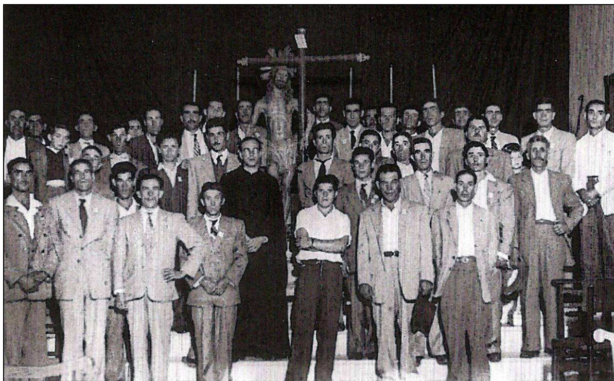
Contribución de los obreros de Arona con un día de salario para el trono procesional del Cristo de la Salud, el Viernes Santo de 1952.