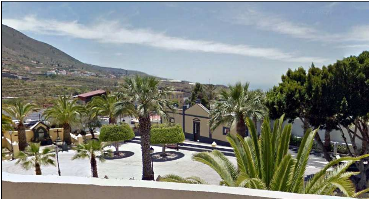
Cementerio de Guía de Isora en la actualidad.

Muchas personas hay en las Islas capaces de dar los diseños de los cementerios que se proyectan; sírvanse los pueblos de sus luces, que su patriotismo las prestará generosamente , y como lo mismo cuesta hacer las cosas bien que hacerlas mal, en vez de indecentes corrales, tendrán decorosos cementerios, donde se contemplen por los vivientes, con un religioso respeto, los restos mortales depositados, de las generaciones que existieron. 8