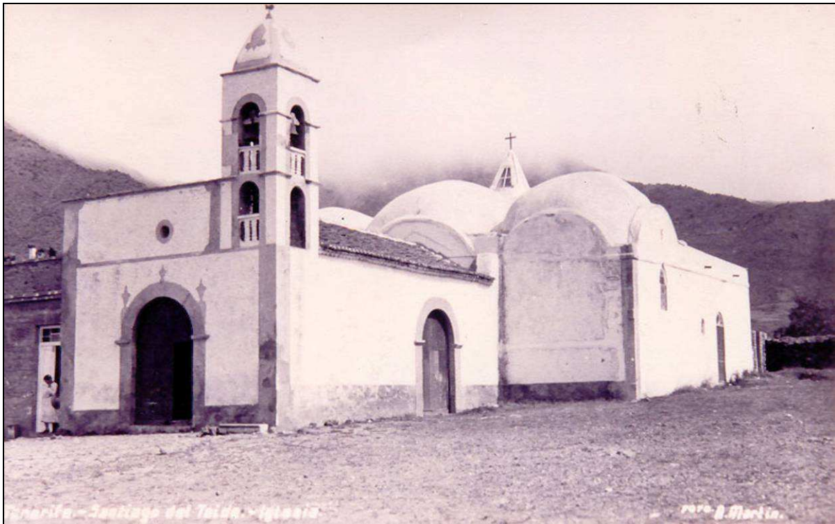
Iglesia de San Fernando, de la Villa de Santiago del Teide, en la que recibieron sepultura los vecinos de Guía de Isora durante 59 años.

Desde el punto de vista religioso, los vecinos establecidos en el actual término de Guía de Isora dependieron inicialmente del beneficio eclesiástico de La Orotava, de 1498 a 1514, y luego del beneficio de San Pedro de Daute (Garachico), de 1514 a 1533; de la parroquia de Ntra. Sra. de los Remedios de Buenavista del Norte, de 1533 a 1679; de la parroquia de San Fernando del Valle de Santiago, de 1679 a 1738 (no obstante, muchos vecinos de Guía, sobre todo de Chío, cumplieron con frecuencia sus obligaciones cristianas en la parroquia de San Marcos de Icod de los Vinos); y a partir de 1738 de la ayuda de parroquia de Ntra. Sra. de la Luz de Guía, elevada a parroquia totalmente independiente a finales de ese mismo siglo. En todas esas iglesias parroquiales fueron recibiendo sepultura, sucesivamente, todos los fallecidos en la amplia jurisdicción de Isora, hasta que en 1860 se bendijo el primer cementerio del municipio.