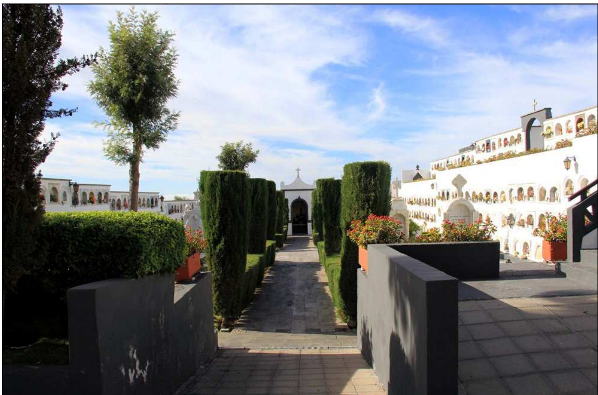
Interior del cementerio de Guía de Isora en la actualidad..

Como curiosidad, el último sacerdote que recibió sepultura en la iglesia de Ntra. Sra. de la Luz fue don Domingo Carreiro, natural del pueblo de Santiago (Orense), que había sido párroco propio de la misma durante más de 12 años y murió en dicha localidad a los 54 años de edad, siendo sepultado en dicho templo el 10 de marzo de 1854.