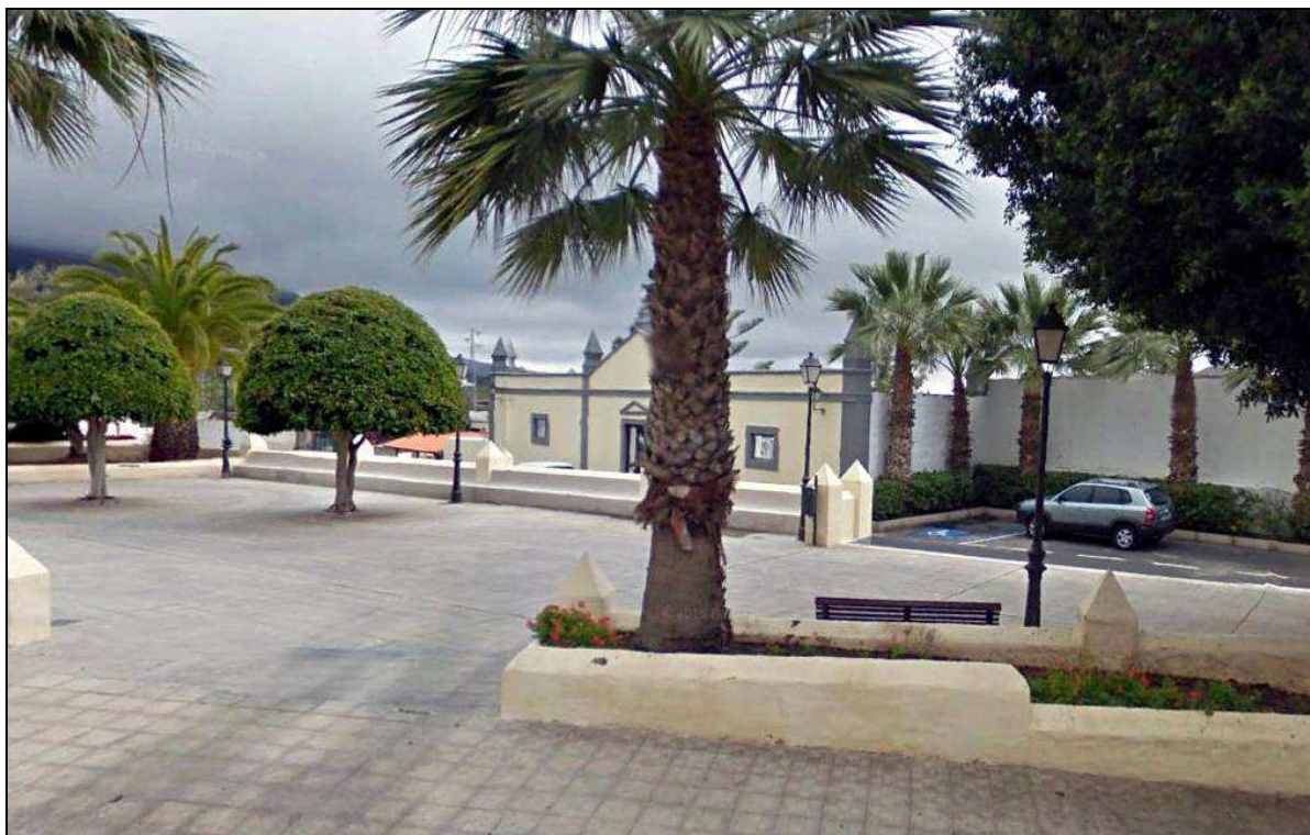
Otra panorámica actual del cementerio de Guía.