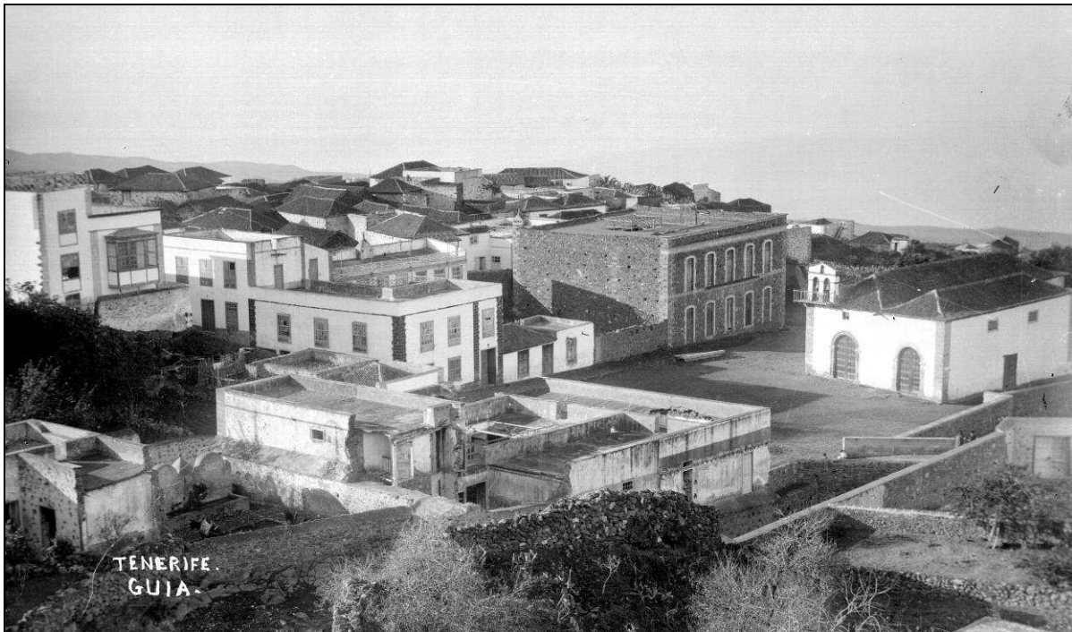
Iglesia de Ntra. Sra. de la Luz de Guía de Isora, primer lugar de enterramiento oficial de dicha jurisdicción.

Por dicho motivo, a partir de dicho año 1738 los vecinos de la amplia jurisdicción de Isora recibirían sepultura en la iglesia de Ntra. Sra. de la Luz, a la que eran trasladados los cadáveres desde los distintos pagos. Gracias a ello, cesaron los largos recorridos hasta la parroquia de la Villa de Santiago, que tanto molestaron a los isoranos. Durante 122 años y medio este recinto religioso, ampliado con posterioridad, sería el único lugar de enterramiento del término, hasta la inauguración del primer cementerio del municipio en 1860; por lo tanto, bajo el pavimento de dicho templo deben seguir enterrados varios centenares de vecinos de Guía de Isora.