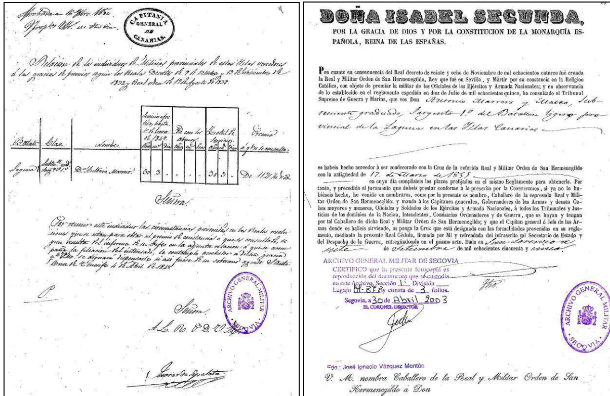
Título del Premio de Constancia y Real Despacho con el nombramiento como Caballero de la Real y Militar Orden de San Hermenegildo.