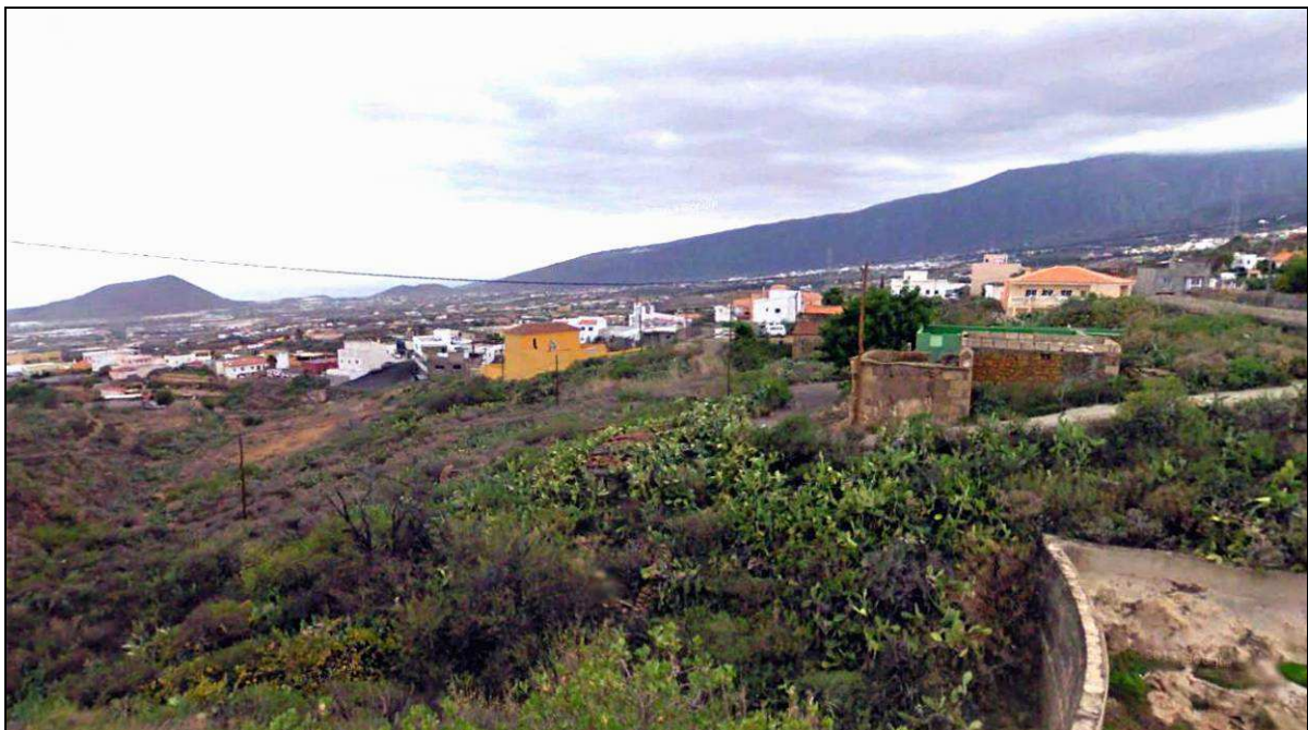
Malpaís de Candelaria ha tenido una notable afición a la lucha canaria, así como un equipo aficionado (el “Añavingo”) y varios puntales.

En la primera mitad del siglo XX, los jóvenes continuaban teniendo pocos entretenimientos, y se divertían enfrentándose por las tardes en cualquier huerta, en amistosos desafíos de lucha canaria. Con frecuencia los jóvenes luchadores de los distintos pueblos se agrupaban en bandos de 15 o 20 luchadores que competían con los de localidades vecinas, sobre todo en las luchadas organizadas con motivo de las fiestas patronales. La lucha era corrida y controlada por tres árbitros u hombres buenos. La ropa de brega se limitaba a un pantalón elaborado con la tela de un saco de pita “ de amoníaco inglés, de la lista azul ”, luego sustituido por sacos de azúcar. Así surgieron los primeros luchadores de Malpaís.