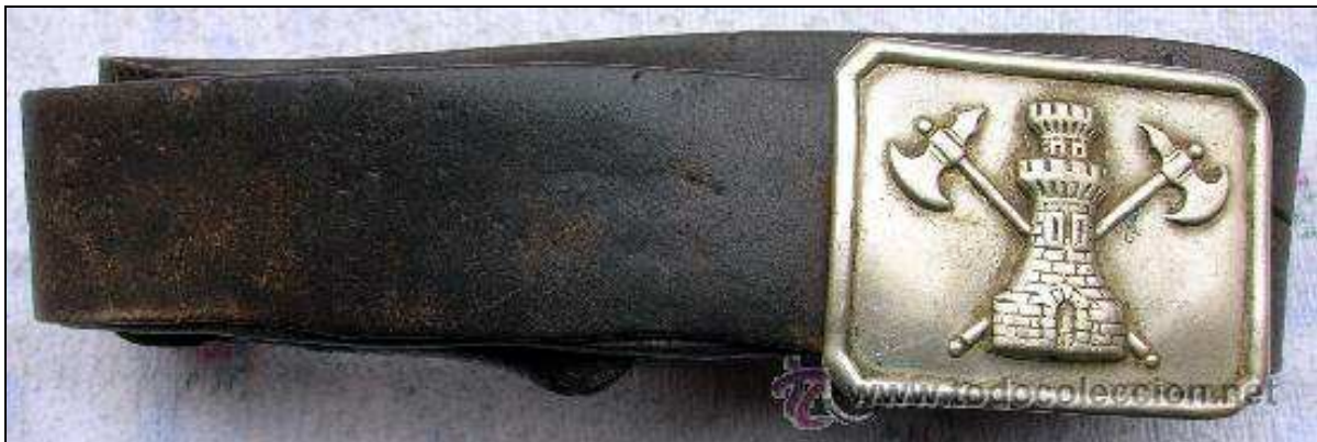
Fotografía de un cinturón de un ingeniero zapador.