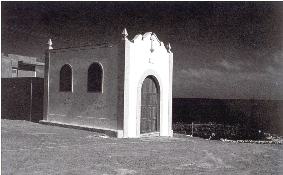
La pequeña “Capilla de abajo”, en El Socorro, construida en 1915.