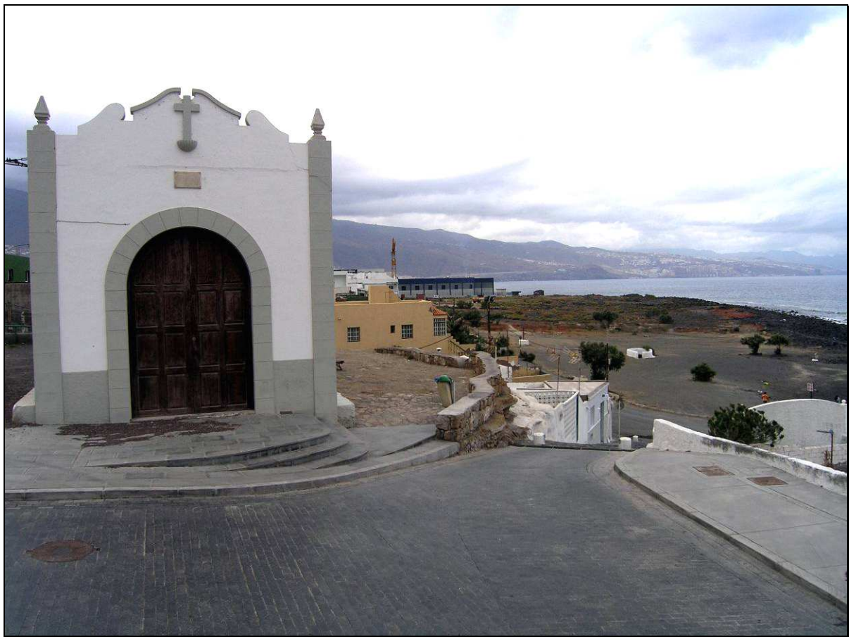
La “Capilla de abajo” en la actualidad, al final de la cuesta que sube desde el Llano de la Virgen.