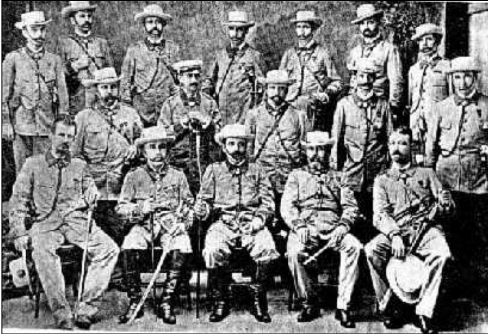
Oficiales del primer Batallón de Voluntarios de Puerto Rico en 1897.

Sin embargo, cuando comenzó la Guerra con los Estados Unidos, el general gobernador de Puerto Rico los llamó nuevamente al servicio, aunque se dispuso que no se les permitiese luchar en sus propias unidades, debiendo ser integrados como soldados individuales en el Ejército regular español. Esta orden no les sentó bien y, con excepciones, la mayoría de los 8.000 soldados del Cuerpo de Voluntarios no respondió a la llamada española, cuando las fuerzas americanas invadieron la isla el 25 de julio de 1898. El Instituto de Voluntarios de Puerto Rico fue disuelto al final de dicha Guerra, en ese mismo año.