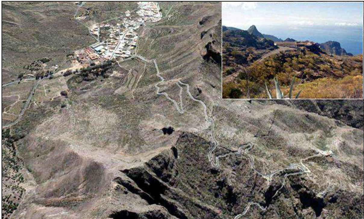
A la derecha, el pequeño caserío de Araza, al que se accede por una corta pista desde la carretera de la Villa de Santiago a Masca.

Volviendo a don Lázaro Martel, hacia 1692 contrajo matrimonio con doña Ana Díaz, natural de la misma villa. Fueron vecinos del Valle de Santiago en las casas de Araza, hoy perteneciente al municipio de Buenavista del Norte, sobre el valle de Masca.