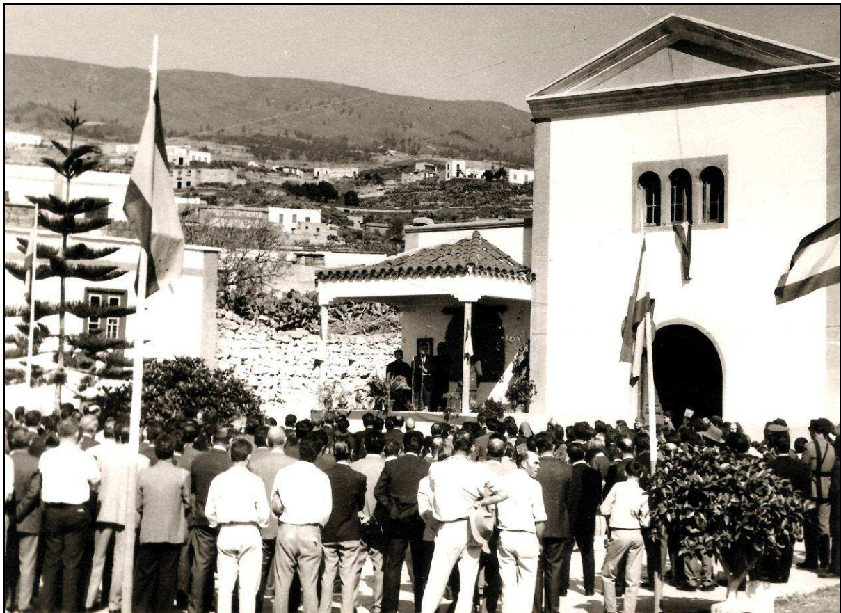
En 1960, el pueblo de Fasnía fue sacudido por un trágico suceso.