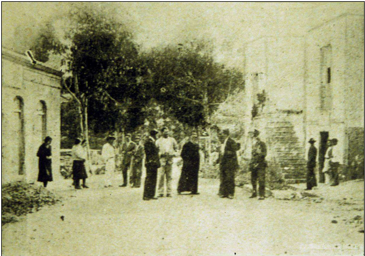
La casa-cuartel de la Guardia Civil estaba instalada por entonces en una casa de El Rincón, que se aprecia a la derecha de la fotografía.