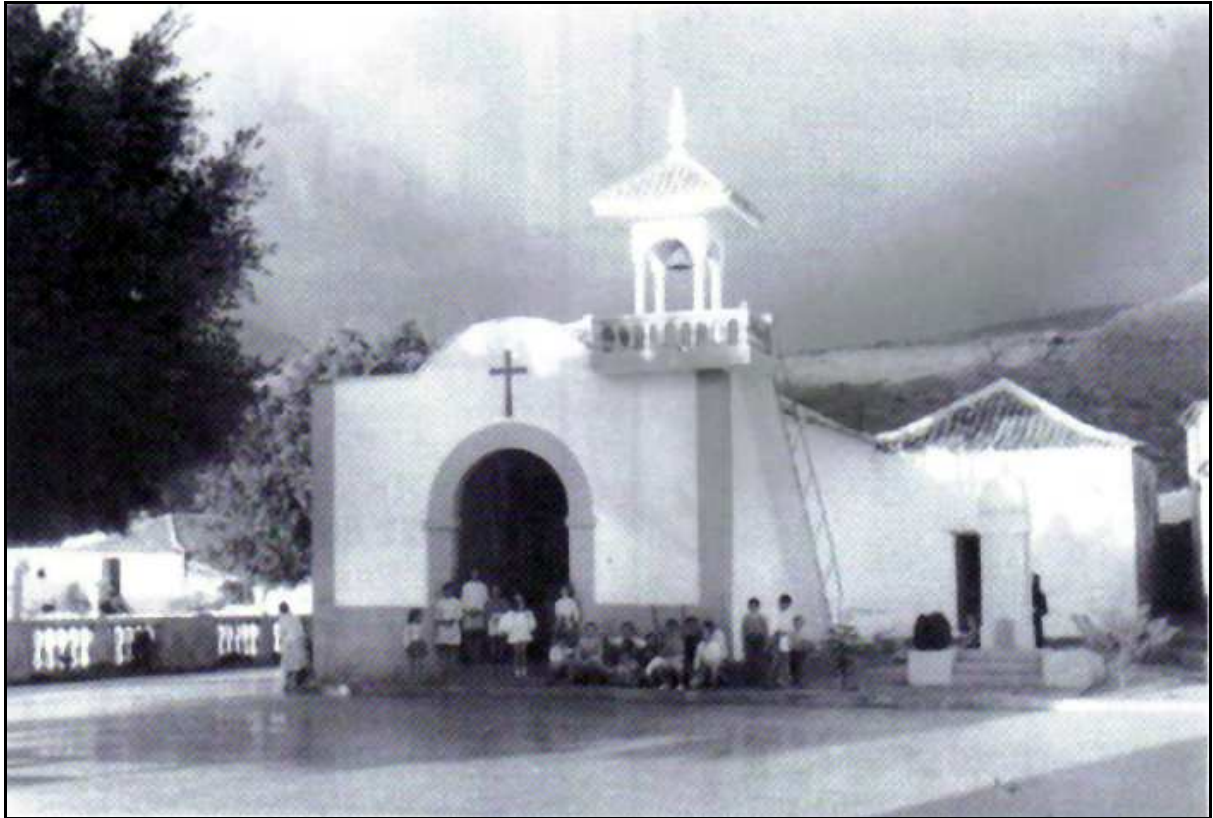
La ermita de Santa Ana de Tamaimo en 1961, antes de la construcción de la torre y de la remodelación de la plaza. A la derecha se aprecia el monumento a los Caídos, hoy desaparecido.