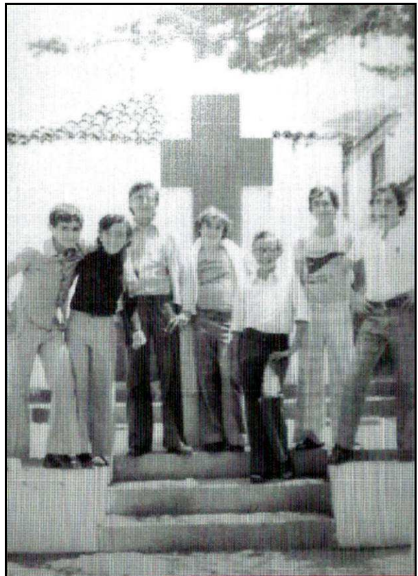
Vecinos de Tamaimo delante del monumento a los Caídos, en su segunda ubicación, junto a la iglesia.