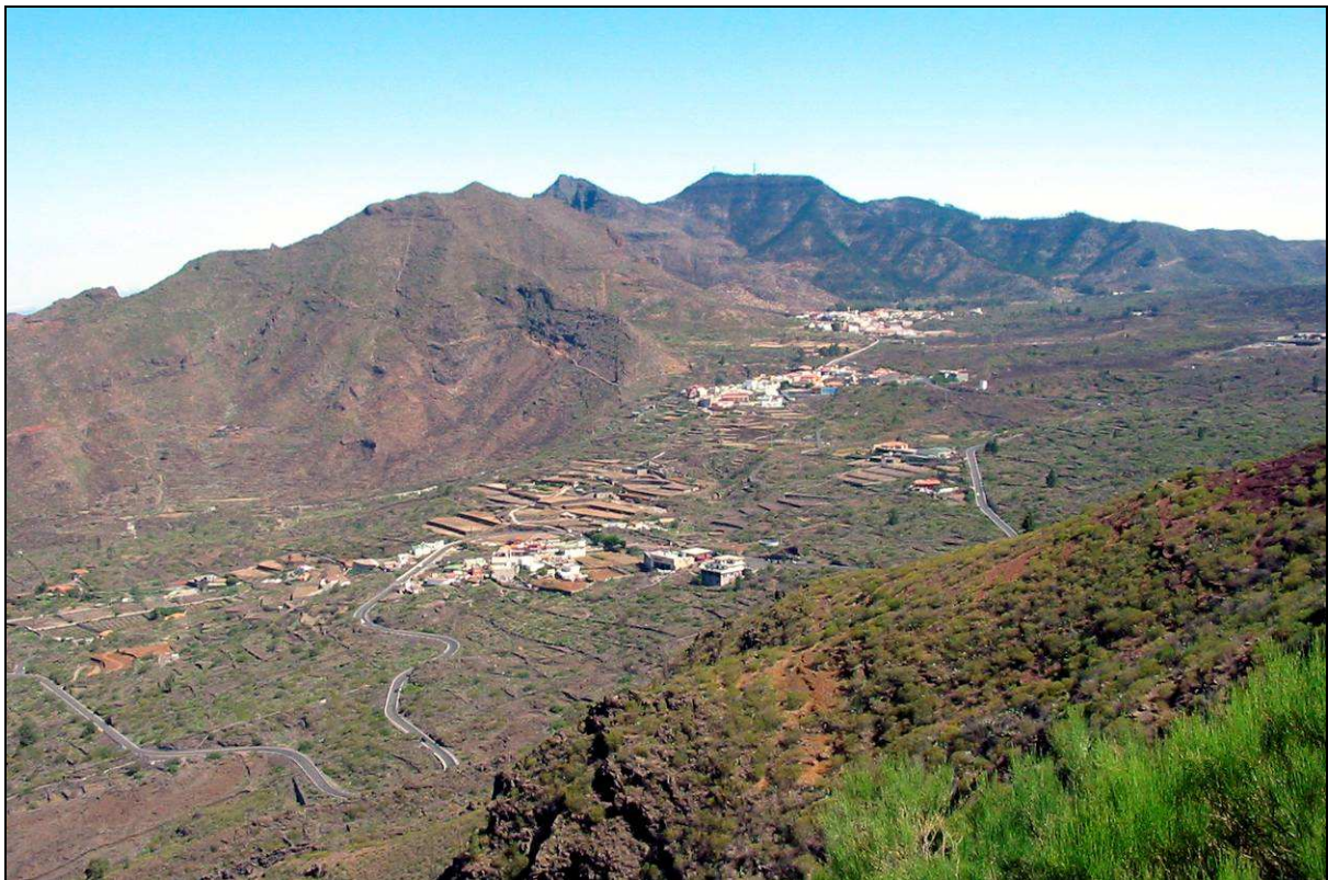
Un total de 13 hijos o vecinos de la Villa de Santiago del Teide perdieron su vida como consecuencia de la Guerra Civil Española.