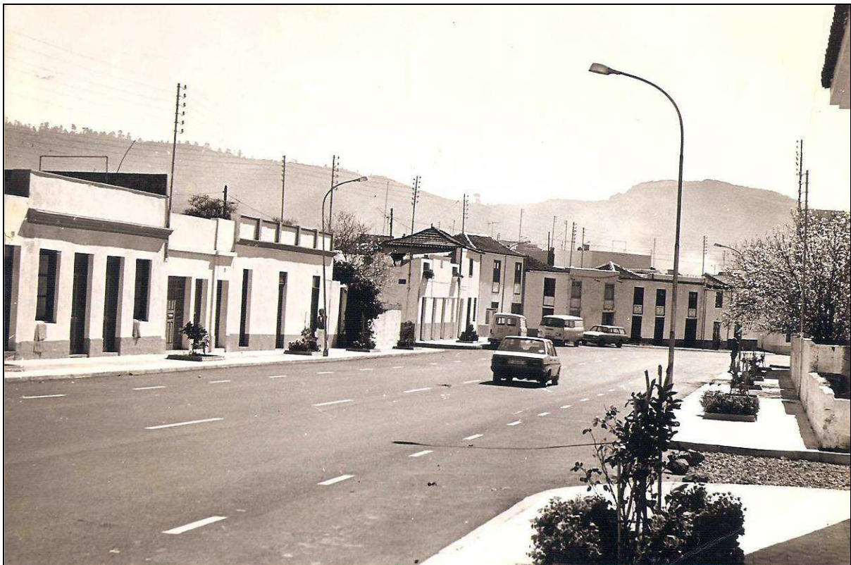
En esta primera etapa, el municipio de la Villa de Santiago solo contaría con cinco jueces de paz titulares.

Con la entrada en vigor de la Ley Orgánica del Poder Judicial y como ocurrió en el resto del Estado español, a finales de 1870 el antiguo Juzgado de Paz de Santiago de Tenerife fue reconvertido en Juzgado Municipal, que comenzó a regir el 1 de enero de 1871, el cual asumió a partir de entonces la competencia del Registro Civil, de nueva creación en cada término, en el que se inscribirían a partir de entonces los nacimientos, matrimonios y defunciones, en los correspondientes libros; y simultáneamente se creó la figura del fiscal municipal. La plaza de secretario la asumiría por lo general un funcionario. Pero esa es una historia de la que nos ocuparemos en otra ocasión.