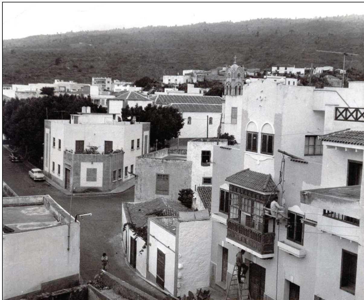
Guía de Isora fue uno de los cinco municipios del Sur de Tenerife que contó con banda de música a comienzos del siglo XX.

Asimismo, en la fiesta celebrada en dicho pueblo en noviembre de ese mismo año, también en honor de Ntra. Sra. de la Luz y conocida como “ La Fiesta del Volcán ”, el día 14 también actuó la banda de música local, ahora de carácter municipal, que acompañó a la procesión de la Virgen y también amenizó el paseo y música programados para esa misma noche en la plaza de la Iglesia; y el día 15, “ A las 6 de la mañana, recorrerá las principales calles de este pueblo, tocando una alegre diana, la Banda municipal de música de esta localidad ”; esa misma mañana acompañó a otra procesión de la Virgen; a las tres de la tarde, “ concierto musical en la plaza de la iglesia por la Banda municipal de música de este pueblo, la que ejecutará un escogido repertorio ”; y probablemente también amenizó la verbena celebrada a partir de las nueve de la noche en la Alameda de la Libertad. 19