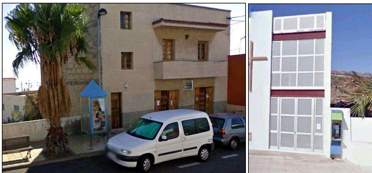
A la izquierda, la cabina telefónica de La Fonda (El Escobonal), la primera instalada en la comarca. A la derecha, la cabina de El Tablado.

Poco tiempo después, la centralita de El Escobonal fue suprimida y los abonados del pueblo fueron agregados a la central de Fasnía, con lo que el teléfono de mi casa pasó del 17 al 277. Luego, cuando en 1972 estos pueblos se enlazaron con la Red Automática provincial de la Compañía Telefónica, se mantuvo dicho vínculo con Fasnía, pues los teléfonos de El Escobonal y Lomo de Mena comenzarían con el prefijo 53, al igual que Fasnía, mientras que los restantes del municipio de Güímar lo harían con el prefijo 51, incluidos los de La Medida y Pájara.