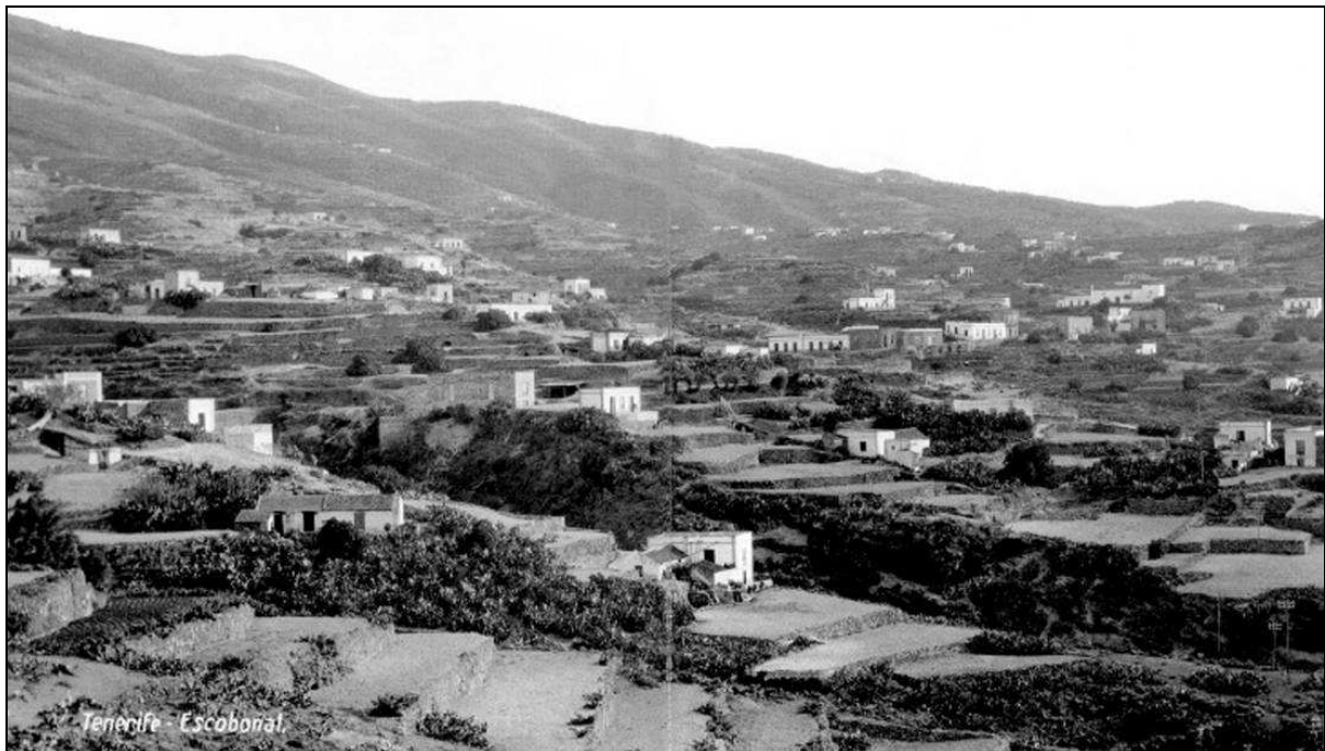
El Escobonal hacia 1933, en el momento en el que se instaló la centralita telefónica. [Foto Benítez].

De acuerdo con el plan general de comunicaciones telefónicas en Tenerife, que había sido aprobado por la Comisión Permanente del Cabildo, en agosto de dicho año 1922 se establecieron, además de los ya existentes, los siguientes circuitos que partían desde Güímar: dos a La Orotava, a Arafo y a Candelaria; y uno a El Escobonal, a El Puertito, a Igueste de Candelaria - Barranco Hondo, a Fasnia, a Arico, a Arico - Candelaria, a Granadilla, a Granadilla - San Miguel y a San Miguel, tal como informó el periódico Gaceta de Tenerife el 26 de dicho mes 10 . Como se ha señalado, uno de los circuitos correspondía a “ Güímar-Escobonal ”.