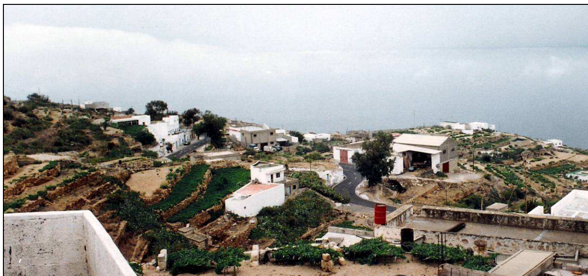
Lomo de Mena ha tenido una notable afición a la lucha canaria.

Hasta principios del siglo XX en los pueblos del Sur no existían equipos de lucha organizados, sino bandos, sin número limitado de luchadores, que se enfrentaban con los de otro pueblo, o se integraban en una selección de la vertiente meridional de la isla que competía con otra del Norte. La lucha era corrida y cada vez que un luchador derribaba a un contrario comenzaba a dar vueltas al terrero para que le saliera otro rival, pero si a la tercera vuelta no se le enfrentaba ninguno, el bando al que pertenecía el luchador vencedor se anotaba la victoria. Como curiosidad, los pantalones de brega se elaboraban con tela obtenida inicialmente a partir de sacos de pita, luego de azúcar.