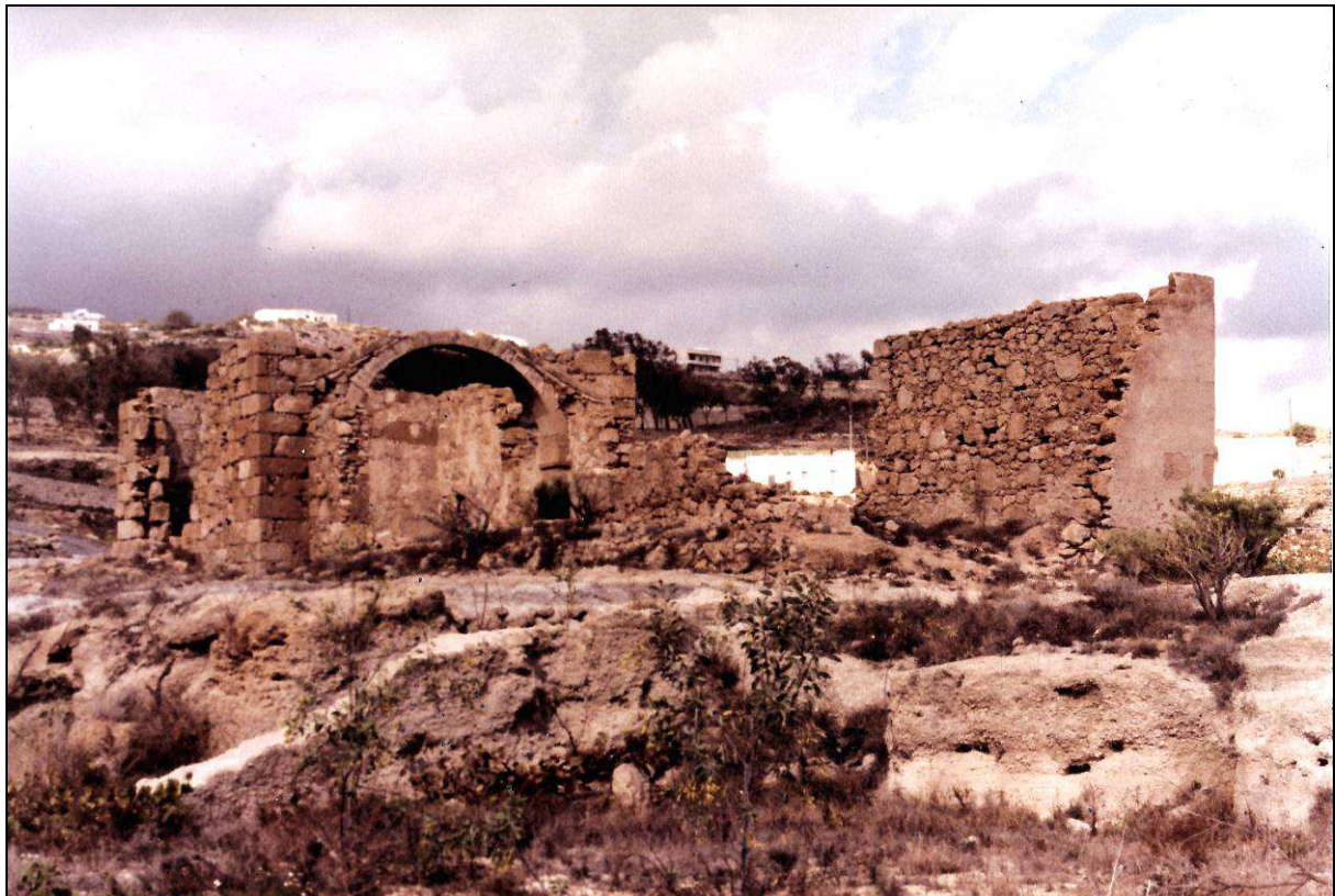
Las juntas vecinales para la creación de la parroquia se hicieron en la plaza de la ermita de San Joaquín.

El día 2 de enero de 1794, durante su visita pastoral a la isla de Tenerife, el obispo Tavira confirmó en la antigua ermita de San Joaquín a 408 personas de los pagos de La Zarza, Fasnía, La Sombrera y Sabina Alta, entre adultos y párvulos. En ese día, según se recoge en el auto de erección, “se enteró del crecido vecindario de aquellos Pagos, y de la falta de asistencia espiritual que padecían por la larga distancia de la Parroquia” , a donde sólo podían concurrir al cumplimiento pascual, no sin gran incomodidad y trabajo, que también experimentaban en llevar a enterrar sus cadáveres y en ir a bautizar a sus hijos a El Lomo, como asimismo en que de tan lejos se les viniese a administrar el Sagrado Viático y Extremaunción, con peligro de que no llegase a tiempo.