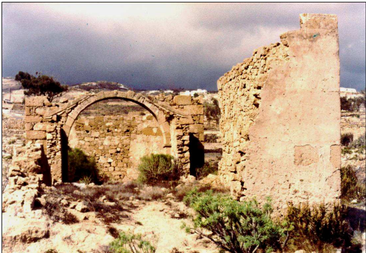
Ruinas de la antigua ermita de San Joaquín, primer templo parroquial de Fasnía, aunque con carácter provisional.