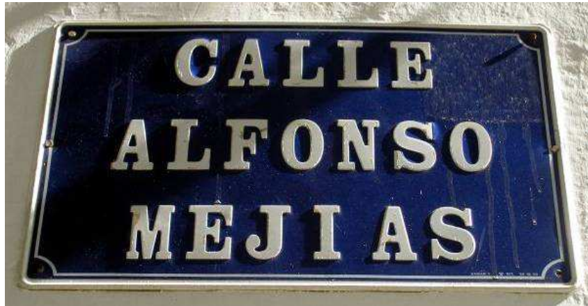
Placa que da nombre a la calle Alfonso Mejías.