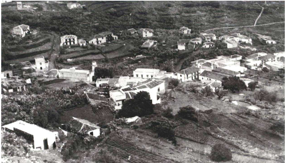
El pueblo de Barranco Hondo tuvo una intensa vida social, deportiva y política en la II República.

Como ocurrió en la mayoría de los municipios de las islas, en la II República el pueblo de Barranco Hondo (Candelaria) tuvo una intensa actividad económica, social y política. En 1931, el municipio estaba dividido en dos distritos, correspondiendo al segundo los pueblos de Igüste y Barranco Hondo, a los que le correspondían tres y dos concejales, respectivamente. Para las elecciones para diputados a Cortes, en el municipio de Candelaria se habían establecido cuatro secciones electorales, establecidas en Candelaria, Las Cuevecitas, Igüste y Barranco Hondo, con una mesa electoral en cada una de ellas.