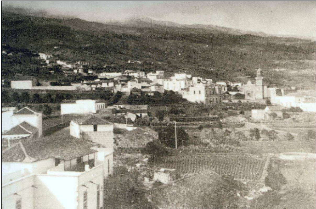
En 1899 se constituyó en Granadilla de Abona la Comisión de distrito de la Cruz Roja.