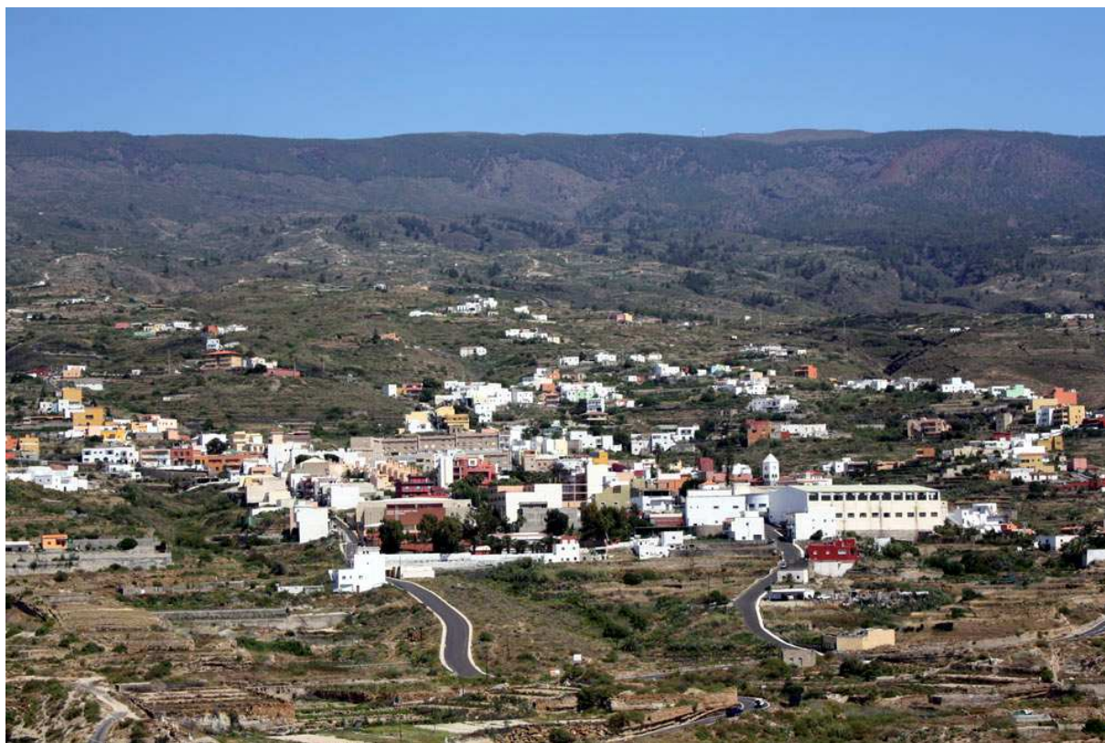
Fasnia contó con Somatén Armado entre 1924 y 1931.

Una vez constituido, en ese mismo año 1924 la estructura del Somatén de Tenerife estaba constituida por 5 cabos de partido, 5 sub-cabos de partido, 37 cabos de distrito (seis de ellos en Santa Cruz, dos en La Laguna y uno en cada municipio), 38 sub-cabos de distrito, y numerosos cabos y sub-cabos de pueblo o barrio. En el partido judicial de Granadilla de Abona, al que pertenecía Fasnia, el Somatén Armado estaba compuesto por 64 miembros: 1 cabo de partido, 1 sub-cabo de partido, 8 cabos de distrito, 8 sub-cabos de distrito y 46 somatenistas. 7