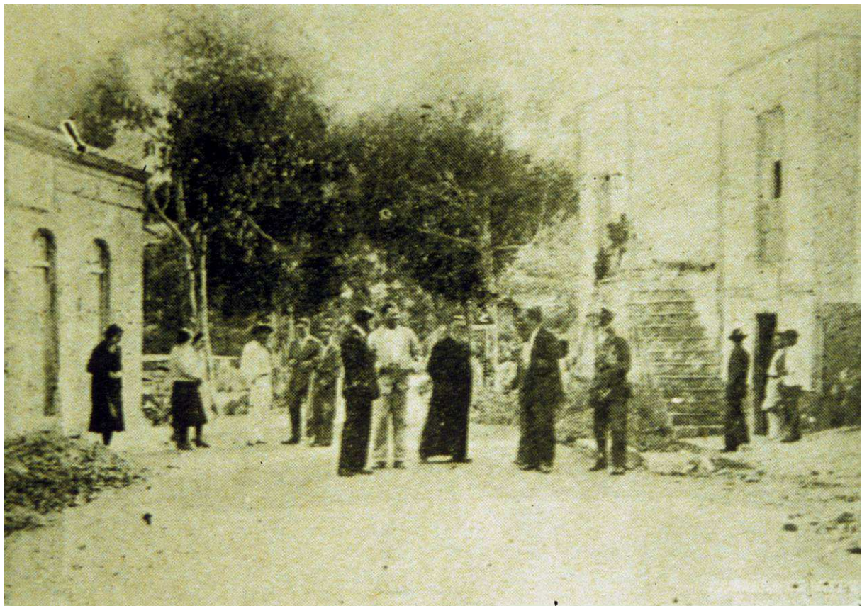
Fasnía en 1933.

El Somatén Armado, antigua milicia popular de rancio abolengo tradicional, surgió en el siglo XI en Cataluña, donde enseguida alcanzó un gran arraigo. Alcanzó especial fama y resonancia a comienzos del siglo XIX, con motivo de la invasión del territorio español por las tropas de Napoleón, pues contribuyó de forma decisiva a la derrota de los franceses. Al constituirse la I República en el año 1873 el Somatén fue disuelto, aunque por poco tiempo, ya que al empezar las revueltas carlistas volvió a ser instituido por Figueras. En 1876 volvió al primer plano del relieve nacional, al levantarse en armas y aplastar en tres días los últimos focos de la insurrección carlista. Más tarde, el Somatén volvió a revitalizarse con ocasión del golpe de Estado del general Primo de Rivera, en 1923, pues en su manifiesto a la Nación, el general hizo un encendido panegírico del Somatén y anunció la inmediata reorganización de esta milicia en los lugares donde ya hubiera existido y su creación en todas las provincias que no la hubieran tenido nunca, así como en las plazas de soberanía del territorio marroquí. Posteriormente, en 1931 el Gobierno de la II República decretó la disolución definitiva del Somatén. No obstante, después de finalizada la Guerra Civil, en 1945 el general Franco recuperó esta institución, que se mantuvo durante décadas. Dado su origen, la Patrona del Somatén Nacional sería Nuestra Señora de Montserrat, que se festejaba el 27 de abril. 1